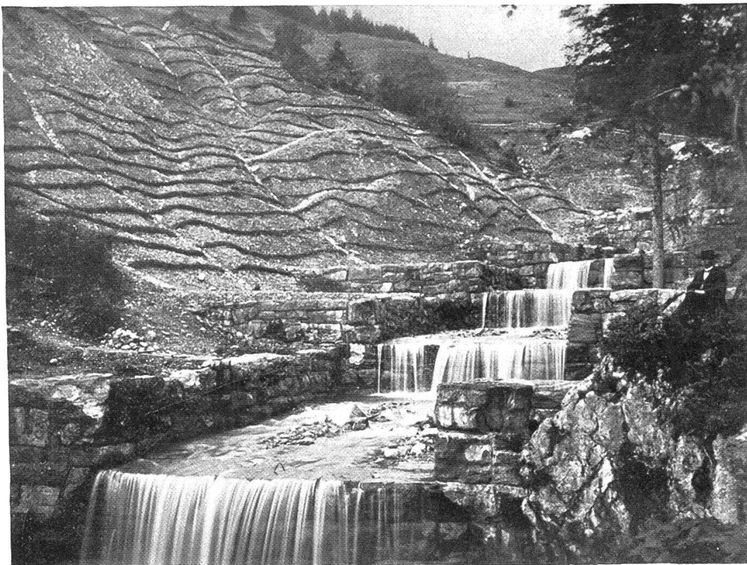
Privatwaldkorporation Dürrenbach (Kt. St. Gallen) Oben: Der zusammengelegte Wald. Unten: Talsperren und Uferversicherungen