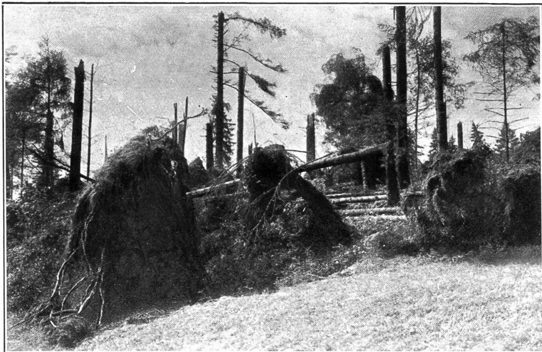
Abb. 3. Geworfene Obstbäume bei Helfenstegen (Neuenkirch)