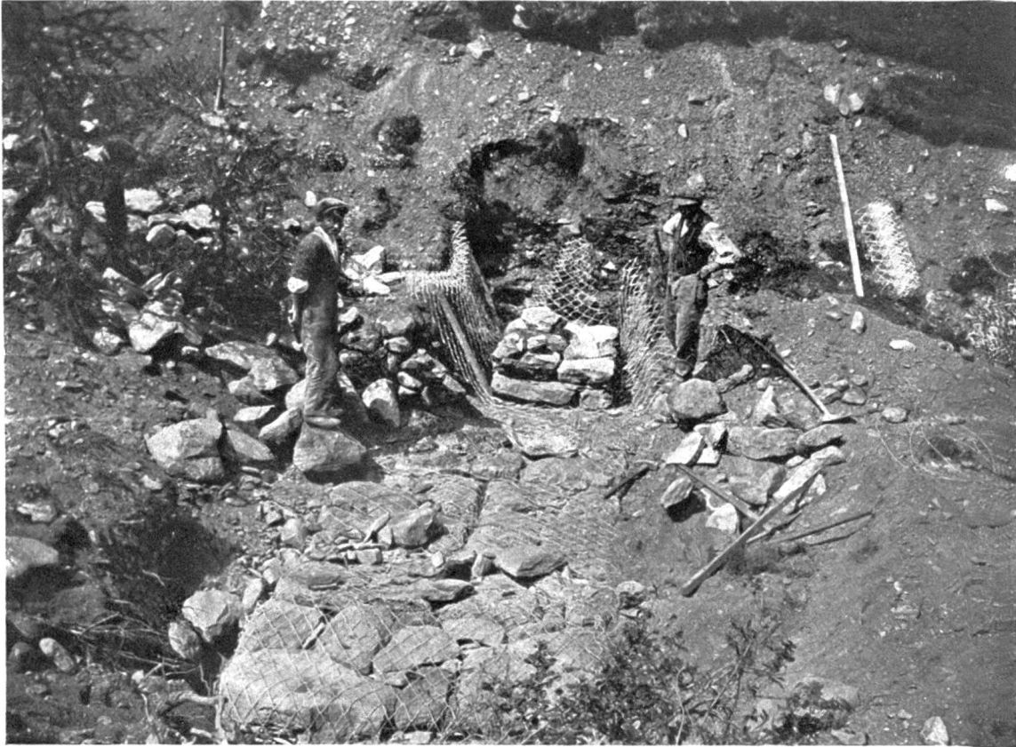
Abb 3. Bau einer Gitterkastensperre bei Olivone. Phot. Müller, 1930. Die erste Lage der Gitterkasten ist ausgeführt und befindet sich gänzlich im Boden, die zweite Lage ist in Ausführung begriffen.