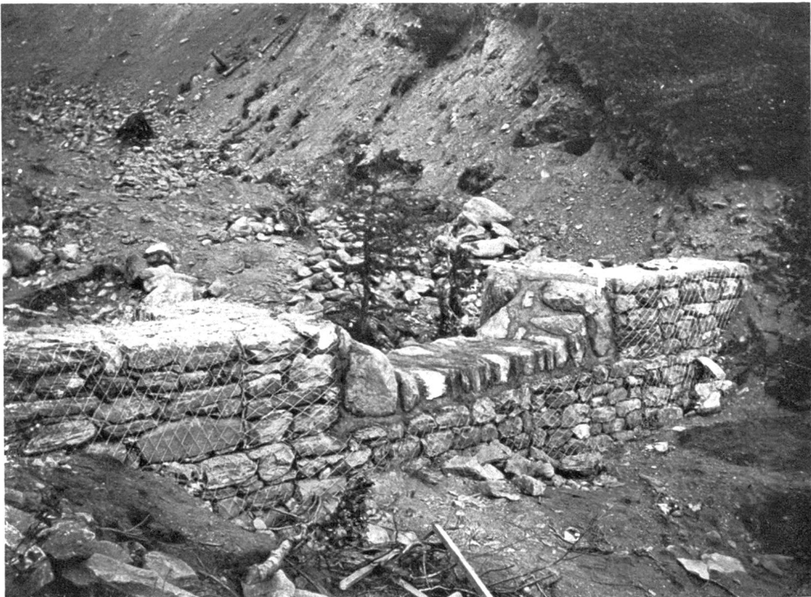
Abb. 4. Gitterkastensperre bei Olivone. Phot. Müller, 1930. Die Abflussfunktion ist durch einen in Mörtel gelegten Steinsatz geschützt (gleiches Objekt wie Abb. 3).