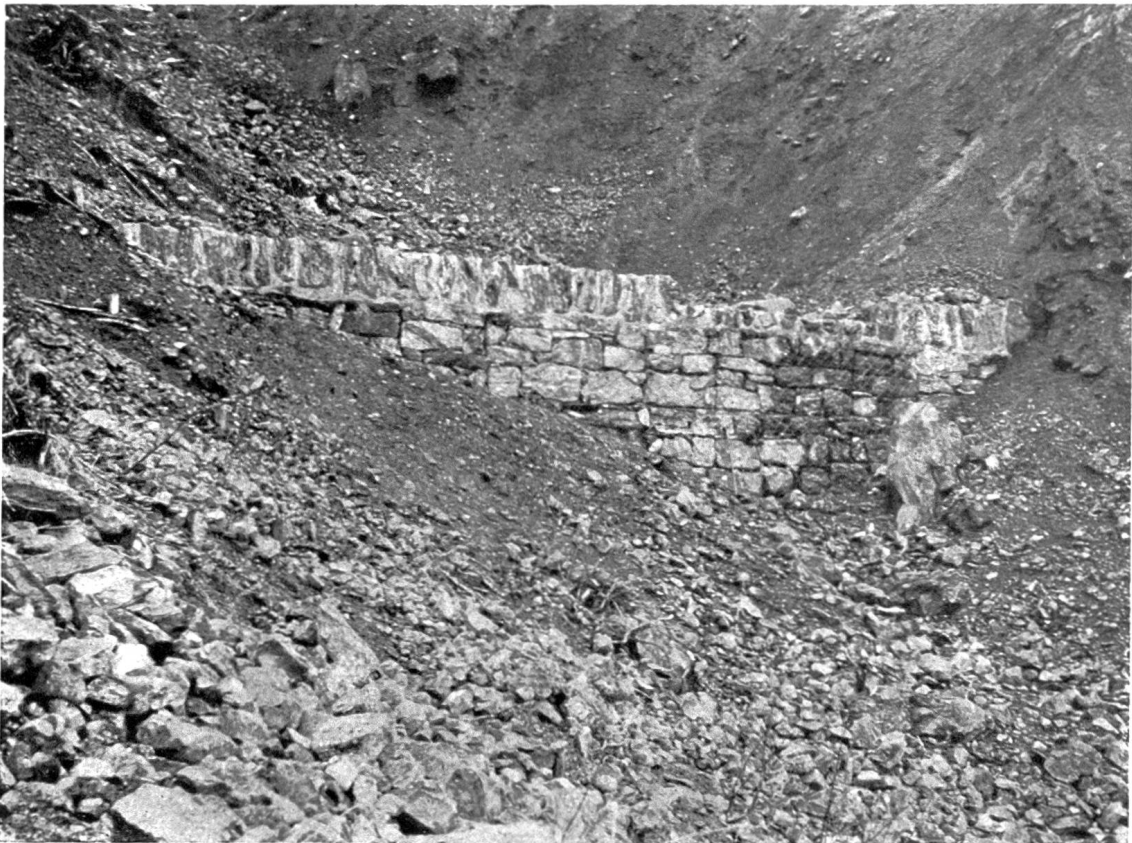
Abb. 1. Vorsperren aus Drahtschotterbehältern mit Holzbedielung im Hagenbach, Nieder-Oesterreich.