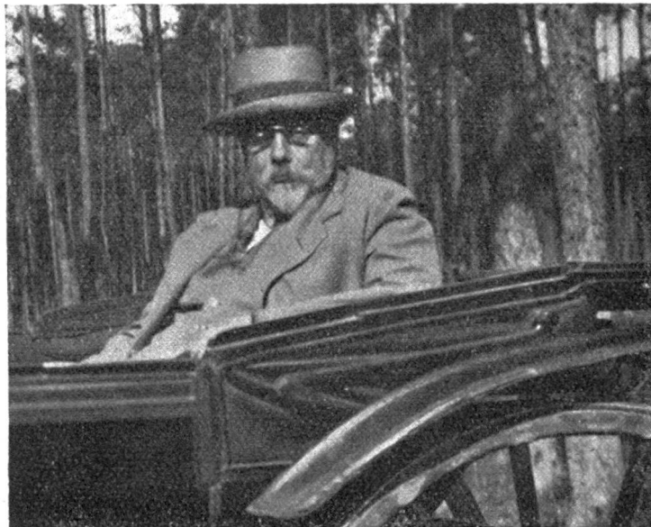
Phot. G. Knuchel, 1923.

Wenige Monate nachdem ihm, anlässlich seines 80. Geburtstages, die Glückwünsche zu seiner reichen und vielseitigen Lebensarbeit darge-