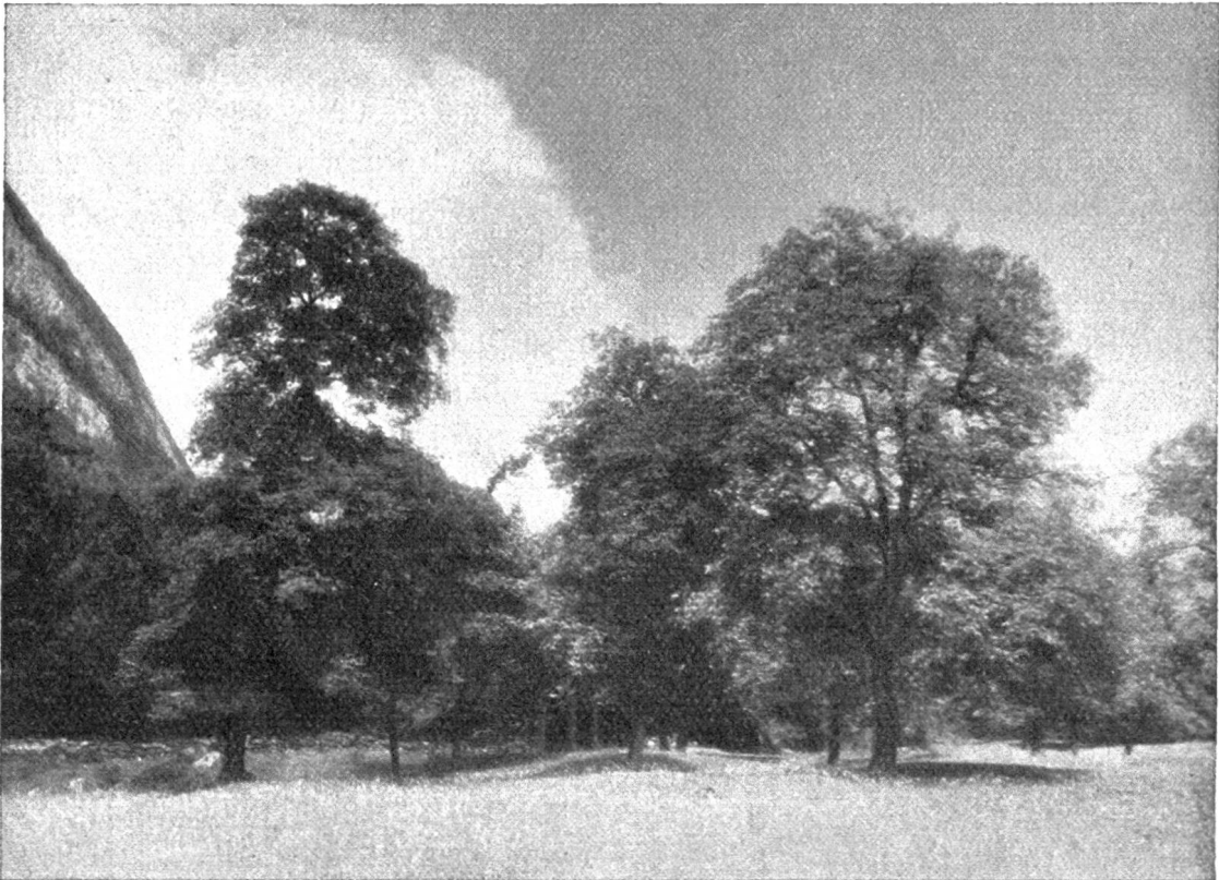
Nußbaumhain bei Frümjen im St. Galler Rheintal.

venienz, sondern einzig und allein unsere landläufigen Nußbäume, unsere „Landnuß“, scheint nach unsern bisherigen Erfahrungen und Beobachtungen das einzig richtige zu sein im Walde. Speziell in den Laubholzbeständen bis etwa 900 m Meereshöhe in den verschiedenen Kalkgebieten, in den Föhntälern am Alpenfuß, am Jurafuß ist der Nußbaum zum Teil heute schon eine sehr wertvolle, aber leider vielfach noch vernachlässigte Mischholzart, die bei geeigneter Pflege fähig ist, mit verhältnismäßig wenig Holzmasse große Gelderträge hereinzubringen. Schon