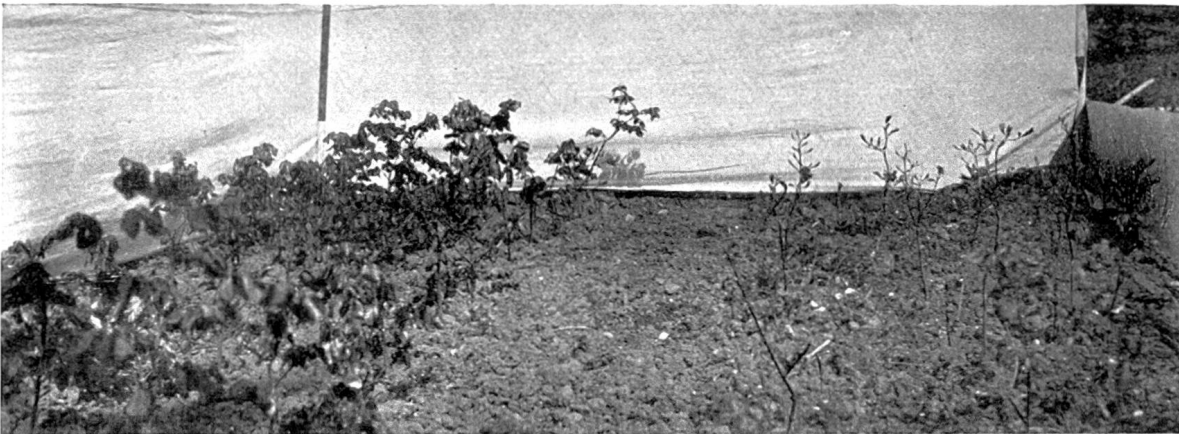
Bild 1. Einjährige Buchen, Nachkommen von: links von frühtreibenden, rechts von spätreibenden Bäumen vom Degenried bei Zürich.