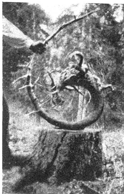
„Spiralfichte“ an überhängendem Fluhrand (Alp Sillern, Adel- boden).

Anm. bei d. Korr. Eine seltene Wuchsform, eine « Spiralfichte » hat Oberförster von Greyerz auf Alp Sillern bei Adelboden beobachtet und mir die hier reproduzierte Photographie und Skizze freundlichst überlassen.