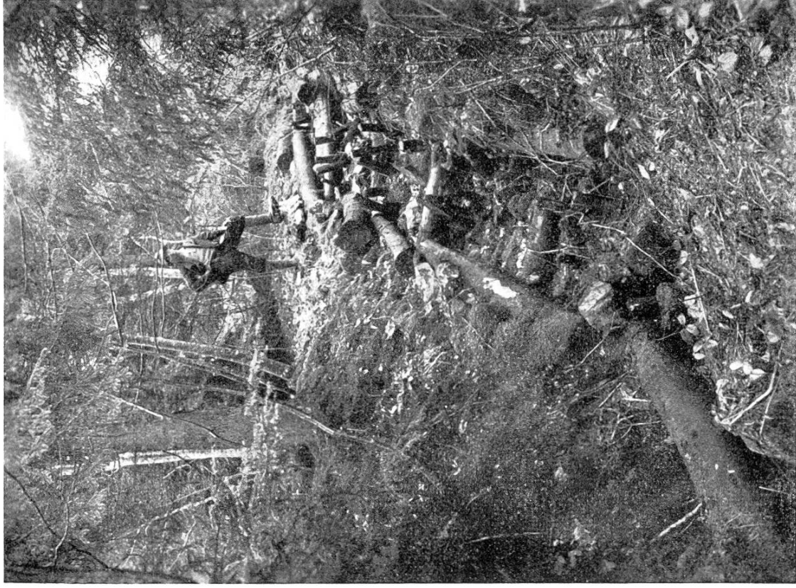
Abb. 1 b. Sohlensicherung, bestehend aus Steinpackung und Astwerkmaterial nebst Leitwerken, Querschwellen aus Holz, nach kurzer Zeit in schlechtem Zustande!