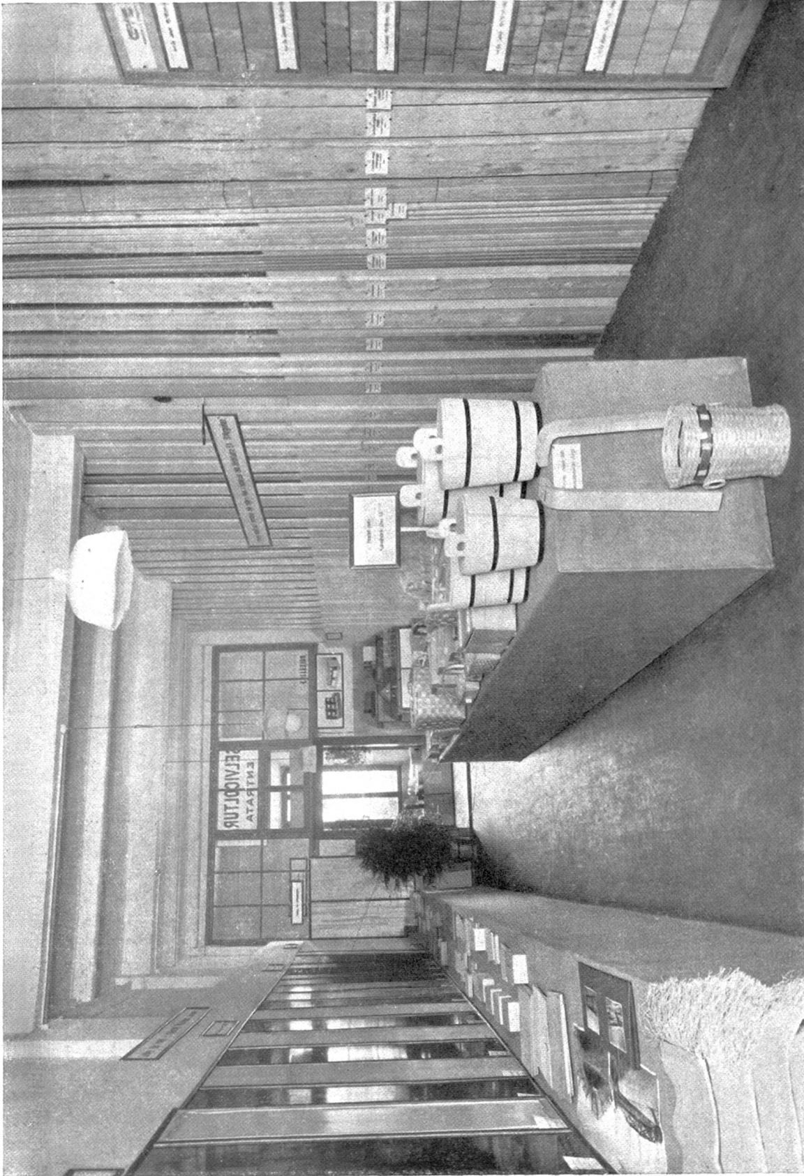
Aus der Forstabteilung an der Esposizione d'Agricoltura, Bellinzona, September 1934. Moderne Holzverwendung. Links : Bau- und Möbelplatten, Faserplatten, Mittellagen. Rechts : Die wichtigsten Handels- sortimente der Sägereiindustrie. Mitte : Für den Tessin wichtige Kübel- und Flechtwaren.