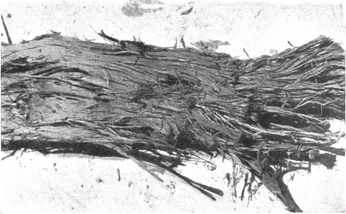
Abb. 5. Zerrissener Arvenstamm aus dem Findelengletscher. Länge 2,30 m, Durchmesser 32 cm.