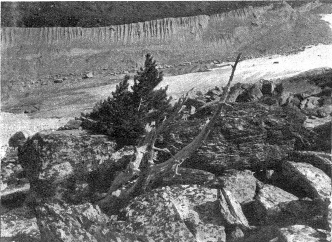
Abb. 6. Junge Arve neben Arvenleiche am linken Gletscherufer bei 2430 m, zwischen Grünsee und Gletscherende.