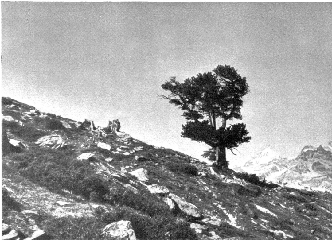
Abb. 4. Oberste Arve am Grünsee, 2370 m. Höhe = 12 m, Durchmesser (1,30 m) = 85 cm, links alte Stöcke.