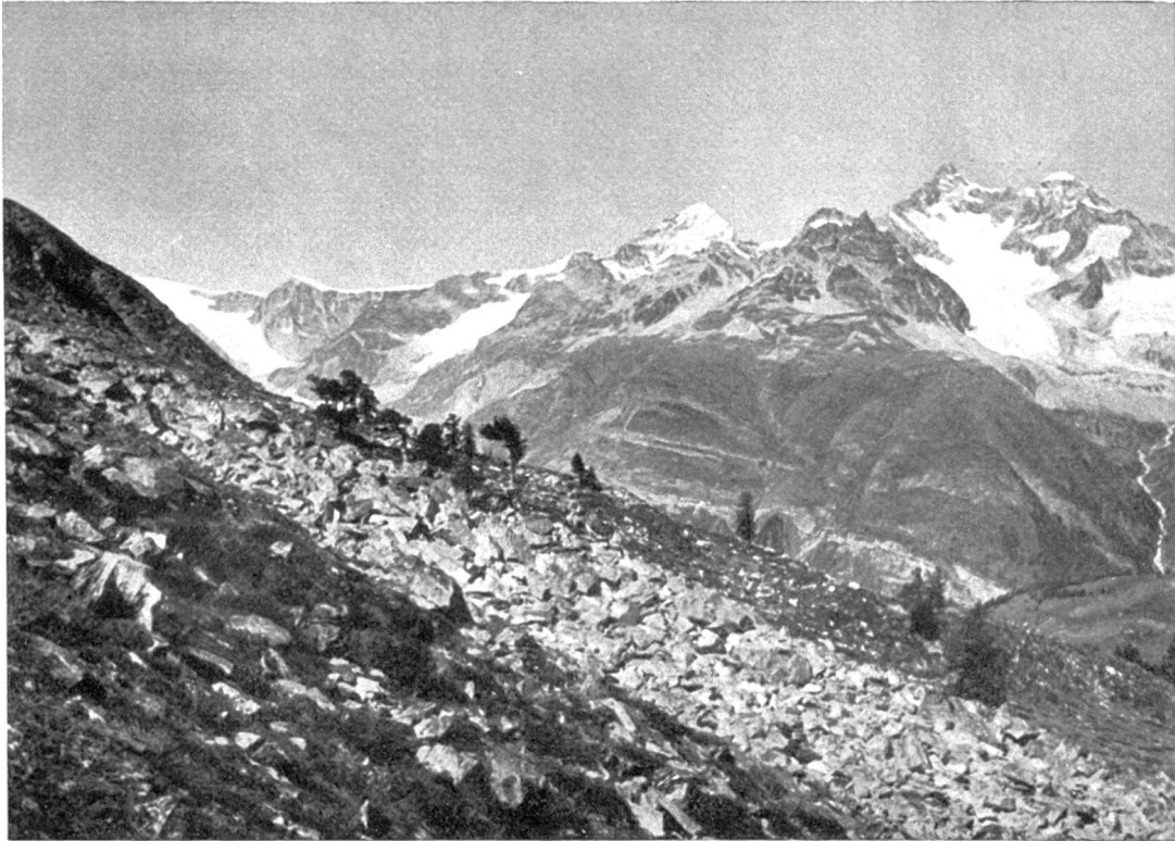
Abb. 3. Die spärlichen Überreste früherer Bewaldung über Grünsee. Arven bis 2370 m ü. M.