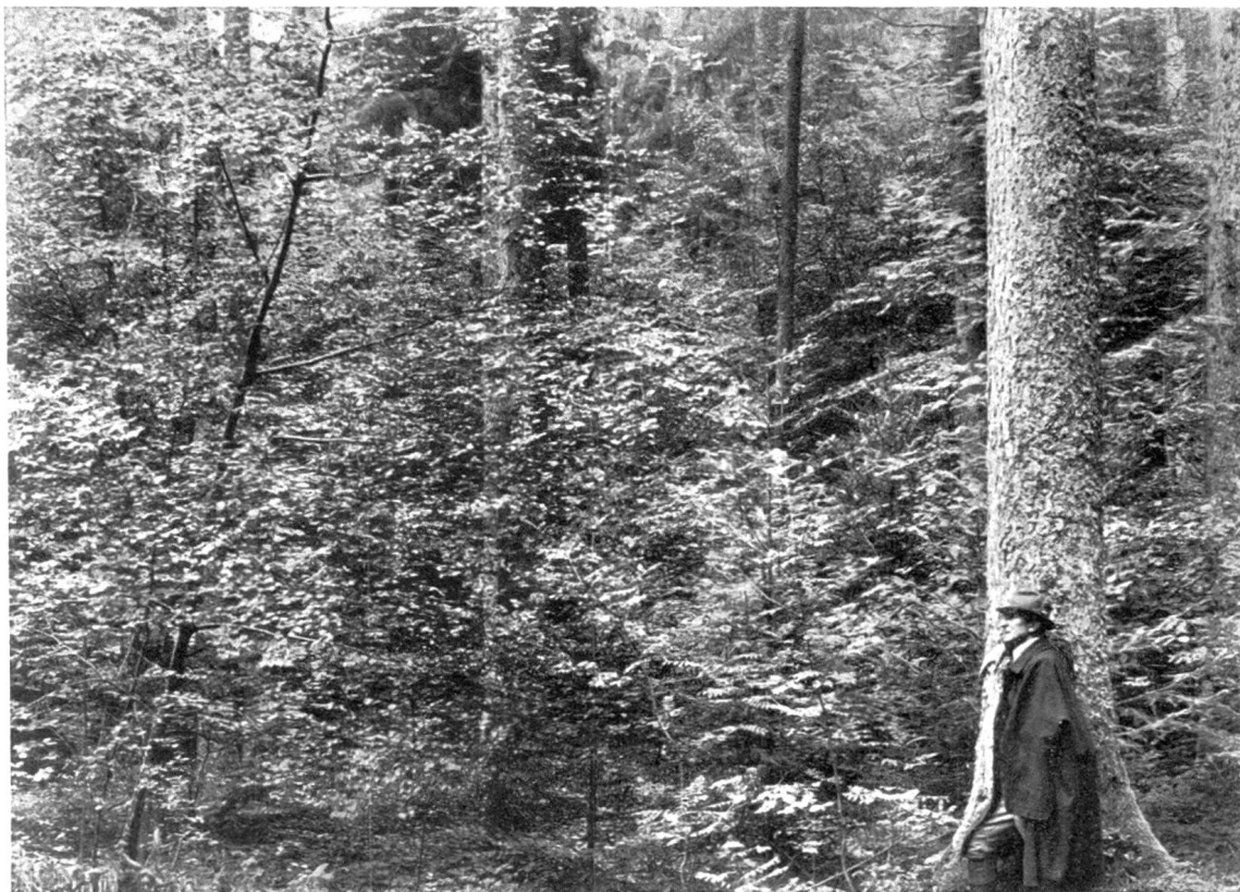
Aufnahme im Herbst 1934.