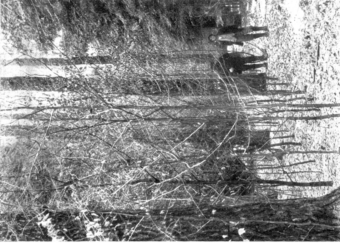
Lichtbild vom Winter 1934/35.

Abb. 1. Aufgelockerter, 80—100 jähriger Dählen-Lärchenbestand. Wurde in den Neunzigerjahren mit Weisstannen streifenweise unterbaut. Die leeren Streifen als Schleifrinne für das zu nutzende Altholz gedacht (nach Oberförster Schlup).