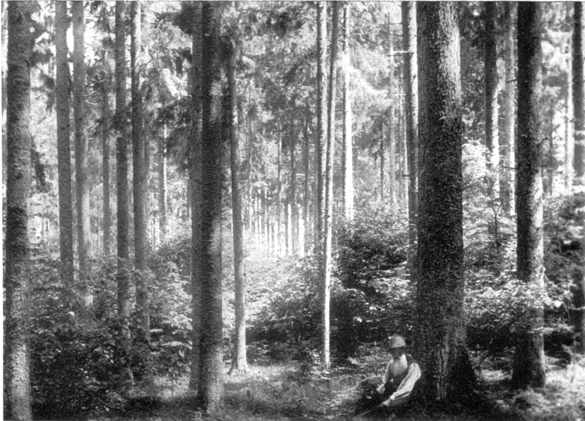
Aufnahme Juni 1924.