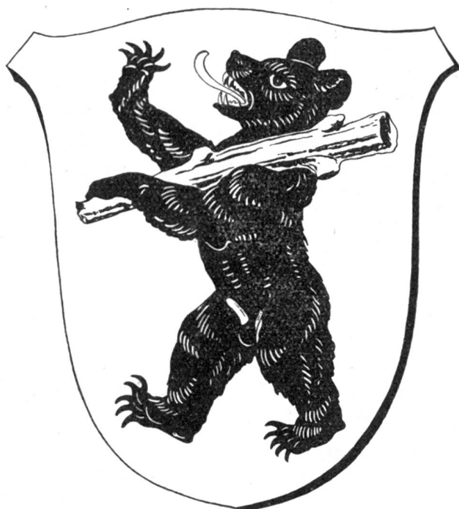
Wappen von Herisau

Mit dieser, vielen schweizerischen Forstleuten ungewohnten Einstellung dem Walde gegenüber soll nicht gesagt werden, dass der Appenzeller der eigenen Verwendung des Holzes seiner Wälder interesselos gegenüberstehe. Die Kreuz- und Querfahrten durch den Kanton riefen immer von neuem das Entzücken der Versammlungsteilnehmer hervor über das Ueberwiegen der Holzbauten, die freistehend die Landschaft beleben oder in langen Reihen Dorfplätze malerisch umschliessen und sich den Biegungen enger Gassen gefällig anschmiegen. Sie sind sauber und gepflegt und zeigen die Liebe der Bevölkerung zum Holzbau. Nichts lässt ahnen, dass seit zwanzig schweren Krisenjahren