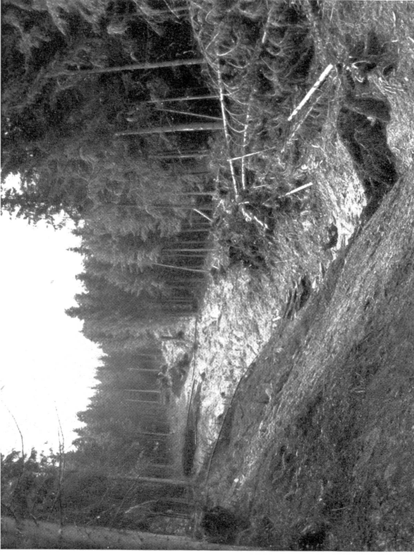
Bild 3. Ein grosser Rutsch hat als Murgang mit etwa 20 m Breite und 200 m Länge den zirka 50jährigen Fichtenwald durchbrochen. Der Graben ist ein Sickerwasserzug, der unten zum Bach wird. Nur kärgliche Erdreste decken noch den anstehenden Fels. (Der Hang ist in Wirklichkeit bedeutend steiler, da schräg aufwärts photographiert.)