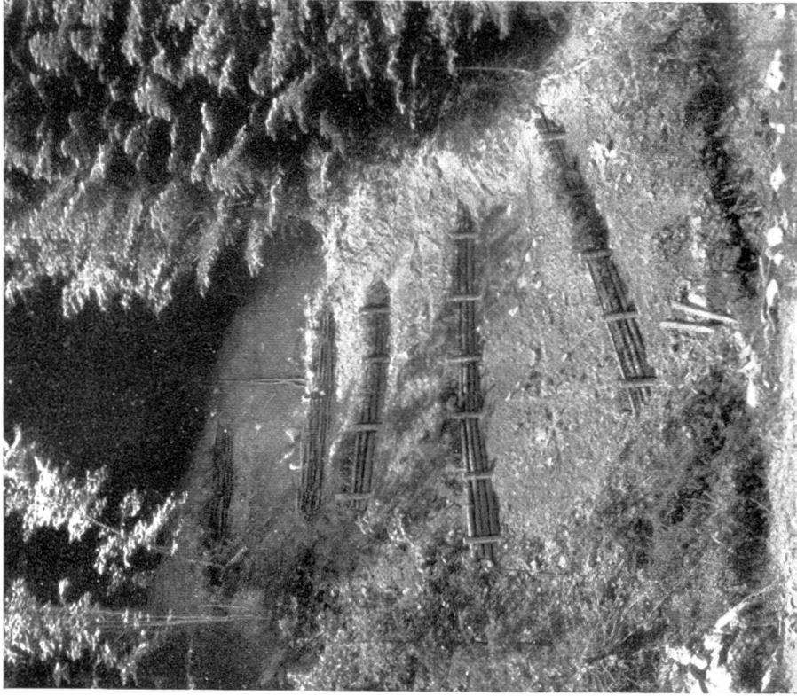
Bild 2. Kleiner Rutsch, oben abgebösch, verbaut, noch unbesät und unbepflanzt. (Unten Stangenhäge, oben Flechtwerk )