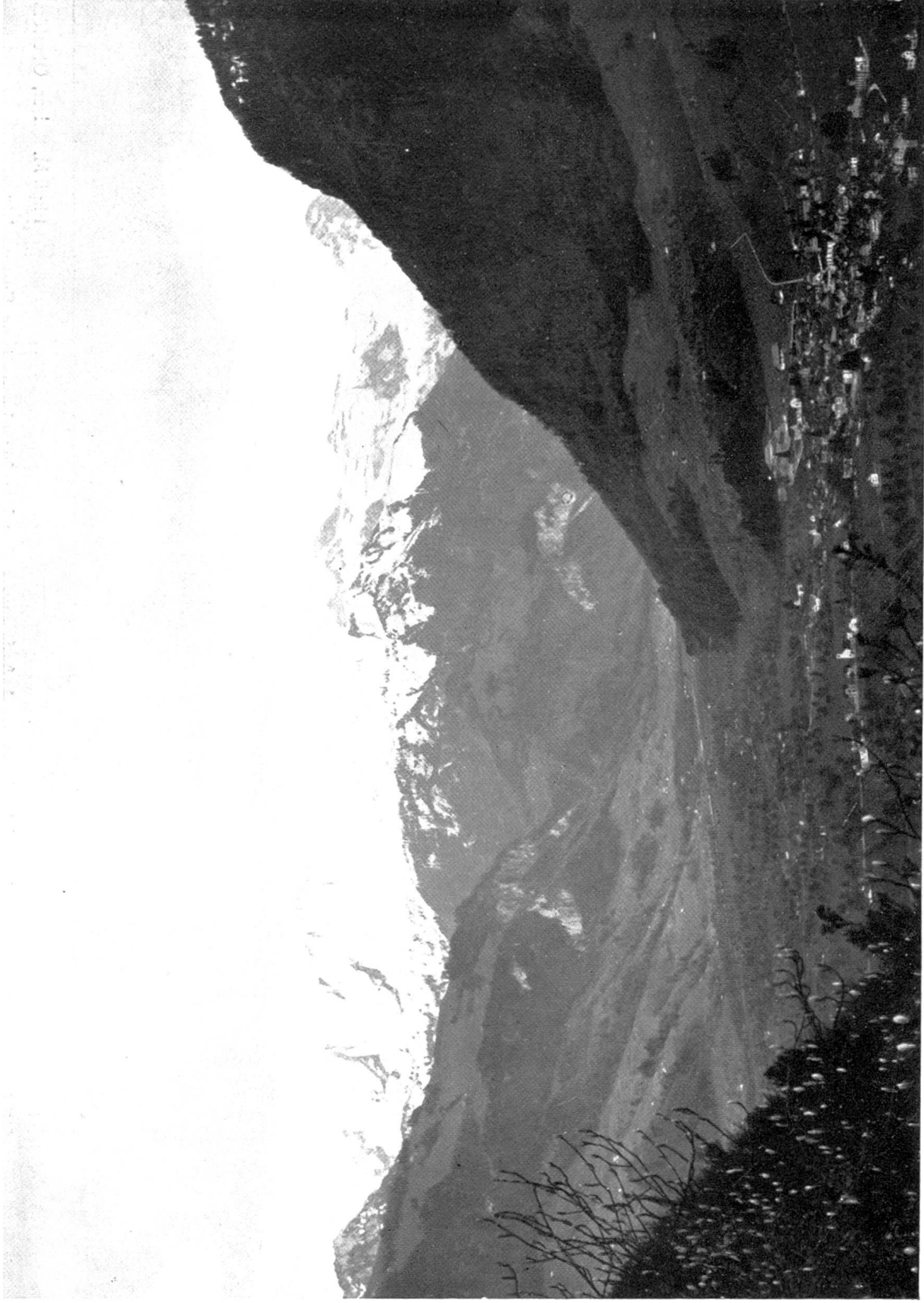
Bild 1. Stans, am Fusse des Stanserhorns, im Hintergrund Brisen, Ruchstock und Laucheren.