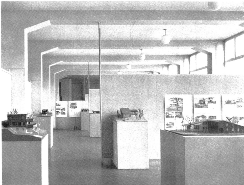
Oben: Abb. 2. Modelle von Umfassungswänden. Unten: Abb. 3. Holzhausbau der Gegenwart.