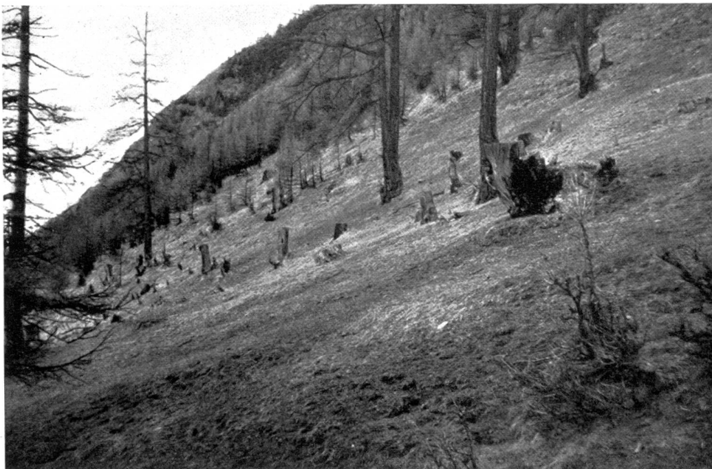
Abb. 2. Zerfallender Weidewald im Avers (Madrisertal).

1933.