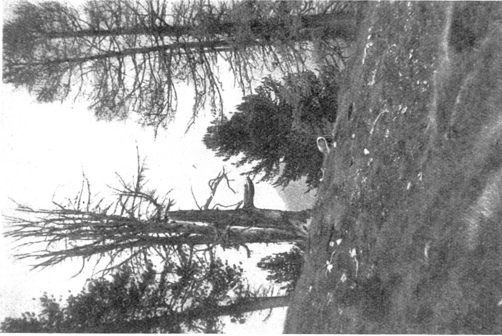
Abb. 7. Drehwüchsige Arve im Bannwald „Jürada“ (Schuls-Scarl).