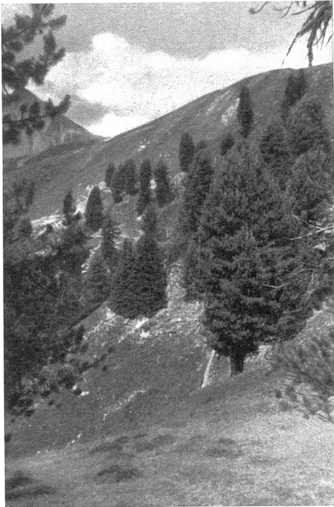
26. VIII. 1937.

vor Enttäuschungen bewahren; denn nur in natürlich aufgebauten und aus standortsgemässen Samen hervorgegangenen Beständen werden waldbauliche Eingriffe wirklichen und dauernden Erfolg bringen. Gewiss, auf günstigen Lagen des Mittellandes und der Voralpen, auf reichen Böden, wird es dem Menschen gelingen, der Natur vorüber-