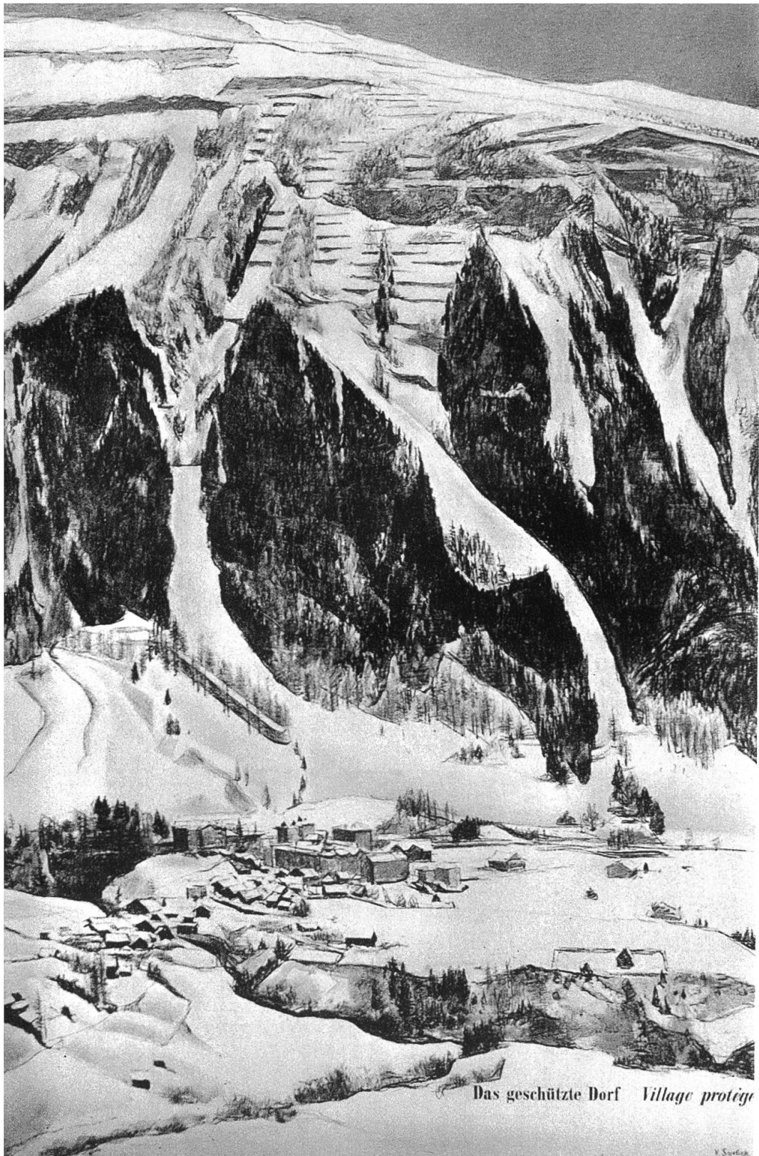
Das geschützte Dorf Village protégé