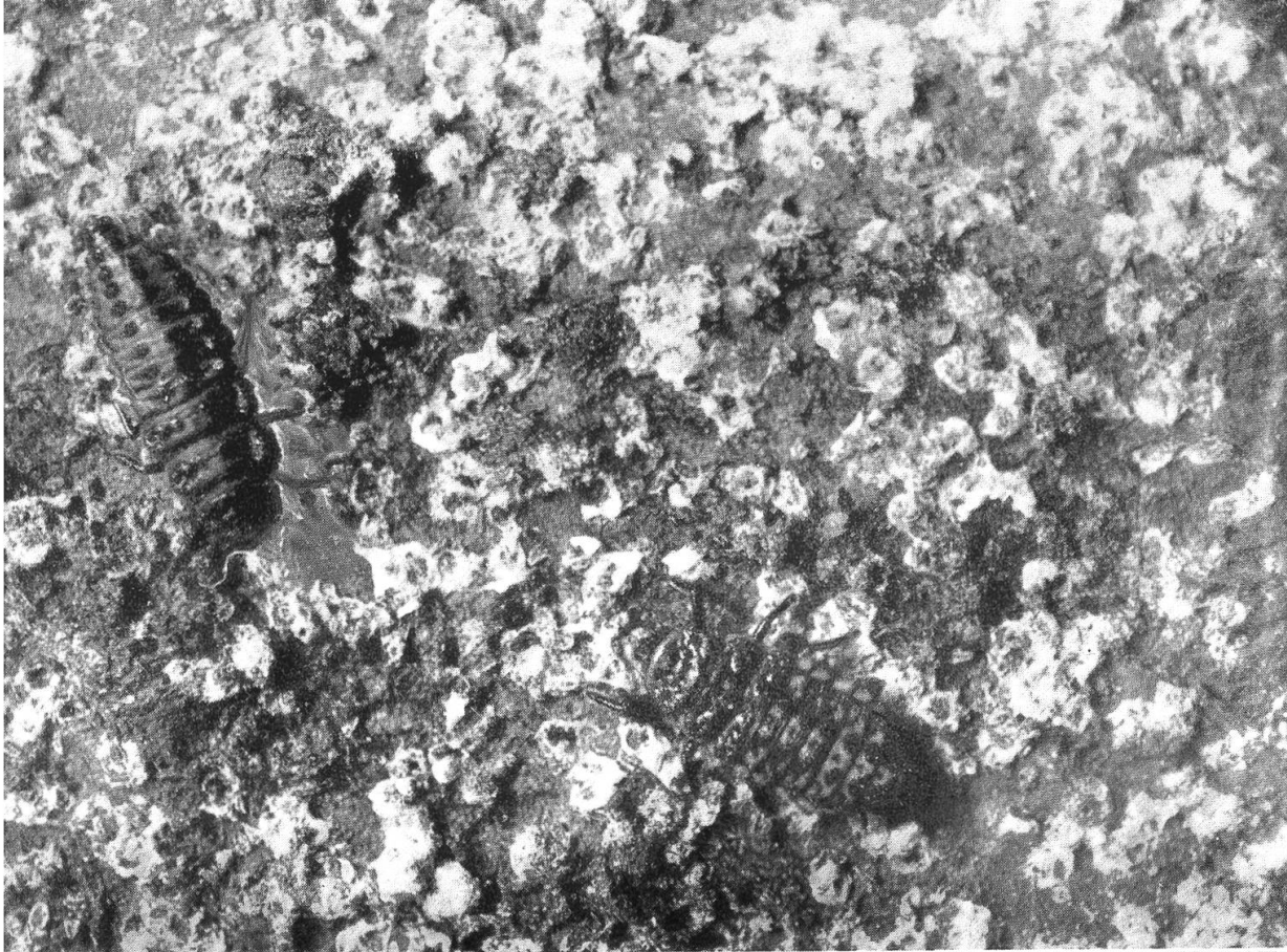
Bild links: Dreyfusia nüsslini-Befall an gelblich verfärbten Trieben einer 150jährigen Weisstanne. Chergräbli, 920 m ü. M., Vergr. 1,2×. Bild rechts: Stammrinde in 8 m Höhe einer 60jährigen Weisstanne mit den weissen Wachshäutchen von Dreyfusia nüsslini und 2 Marienkäferlarven (Aphidecta oblitterata L.). Grabenberg, 890 m ü. M., Vergr. 6×