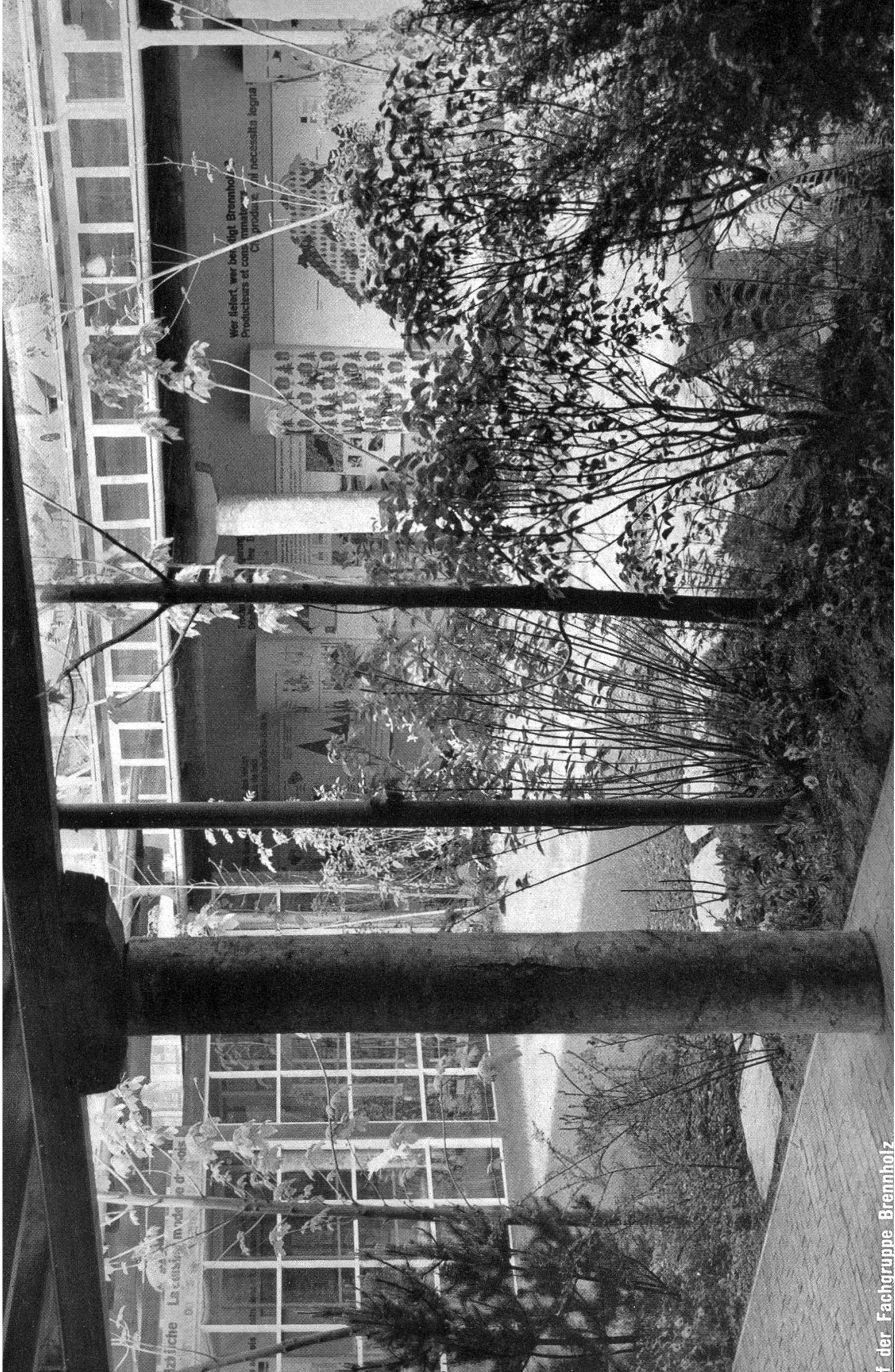
f der Fachgruppe Brennholz