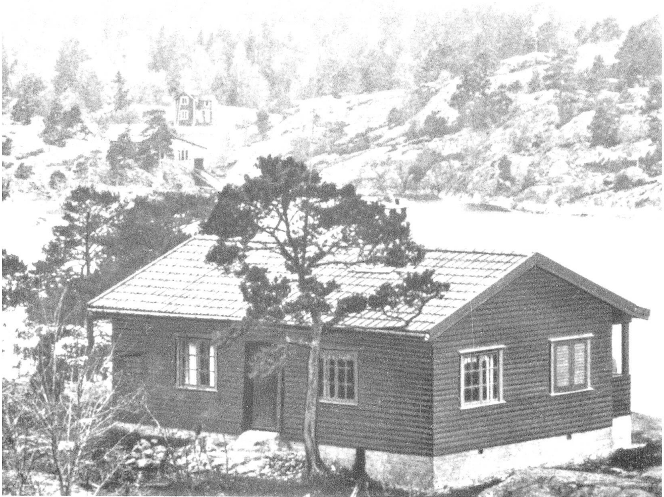
Bild 1. Wochenendhaus bei Stockholm.