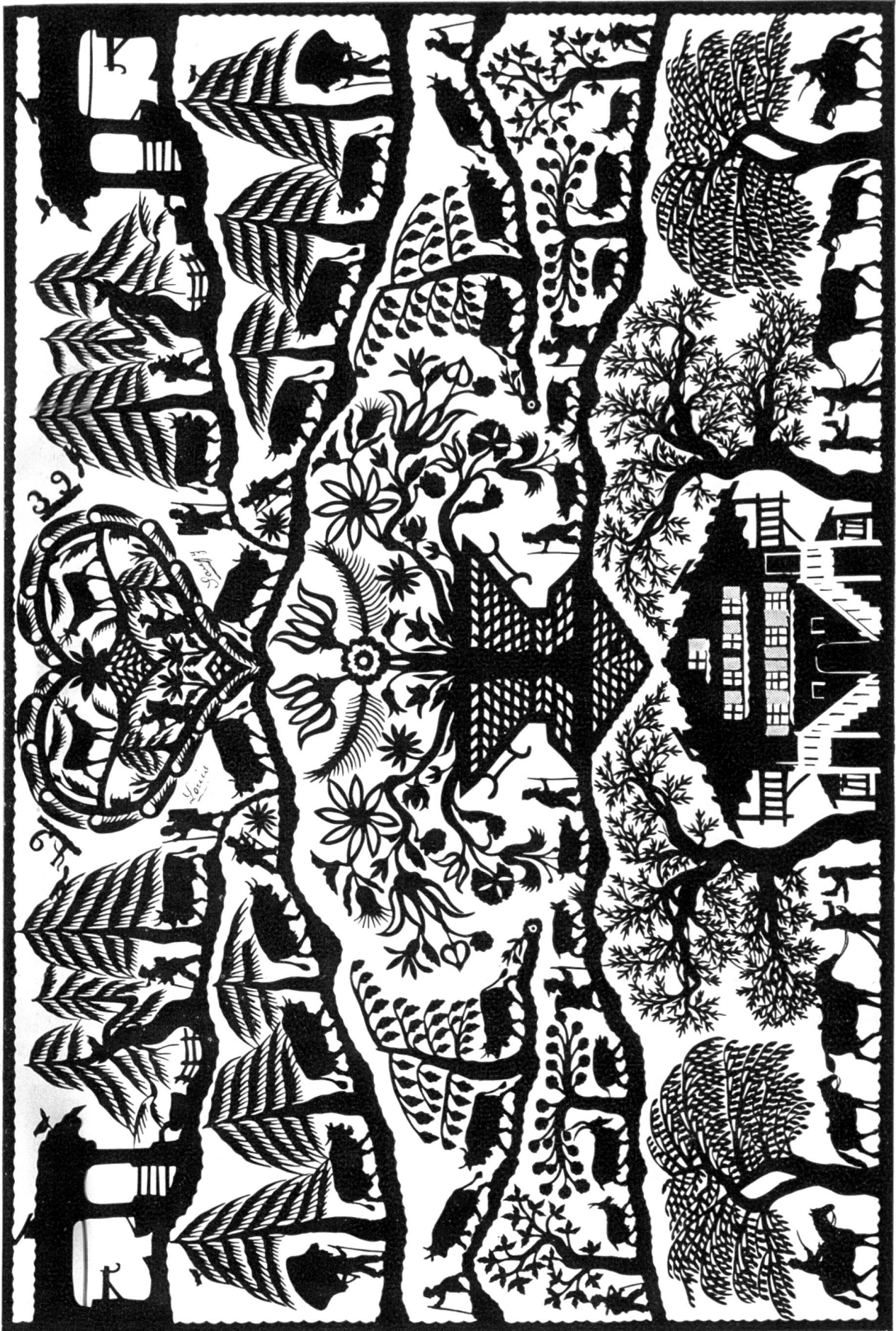
Alpaufzug. Scherenschnitt von Louis Saugy, Rougemont.