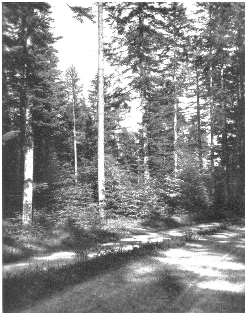
Bild 1. Ortsgemeinde Oberriet, Abt. 8. Altholz mit Naturverjüngung Fi, Ta, Bu.