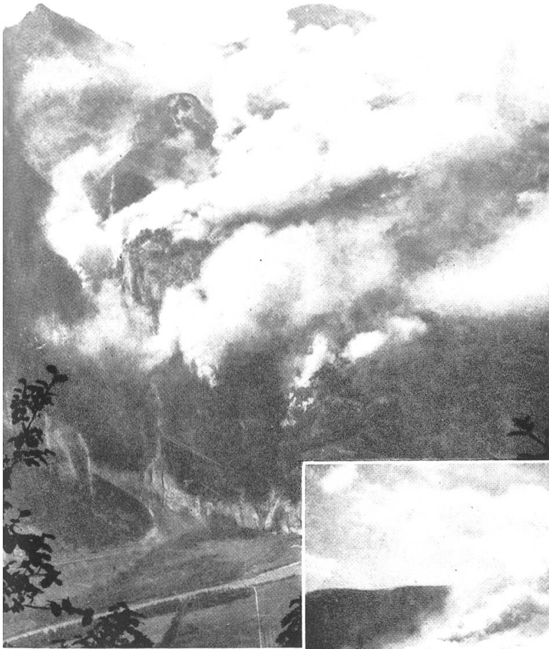
Entwicklung des Brandes am Nachmittage des 21. August 1943 in den westlichen Töbeln (Scheidtobel, Großtobel).