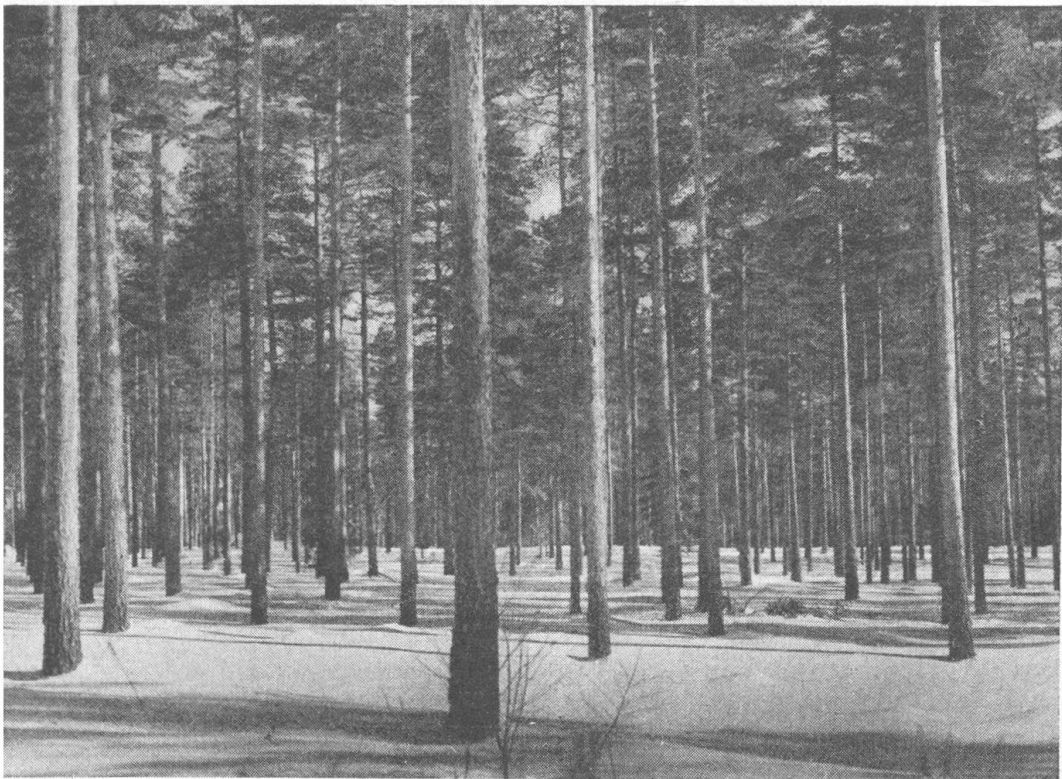
90jähriger Kieferbestand im Winter, auf der Brandfläche aus Natursaat gewachsen. Vorrat 450 m 3 pro ha.

Gedenkt man also eine kahlgeschlagene Fläche abzubrennen, so ist folgendes zu beachten: die beste Brennzeit ist Mai—Juni, aber auch im Juli oder August kann man bei trockenem Wetter brennen. Auf der Hiebsfläche sind die Zweige und Reiser gleichmäßig auszubreiten und etwaige küm-