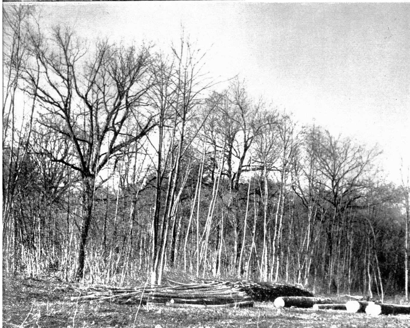
Tafel IV, Rückseite Plenterbetrieb