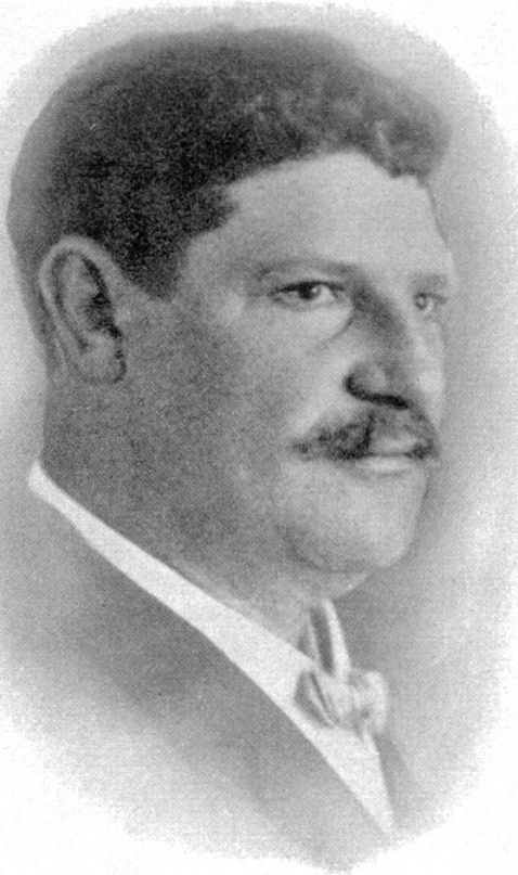
A. Angler 1897—1923