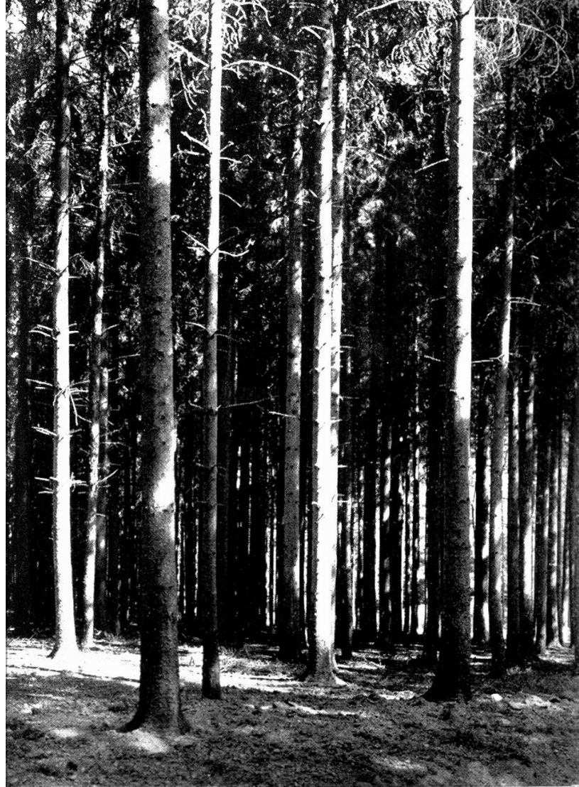
Tafel III, Vorderseite Oben: Fichtenforst. Unten: Mittelwäldchen