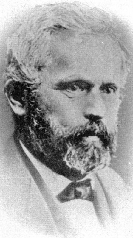
A. Humboldt 1855—1882