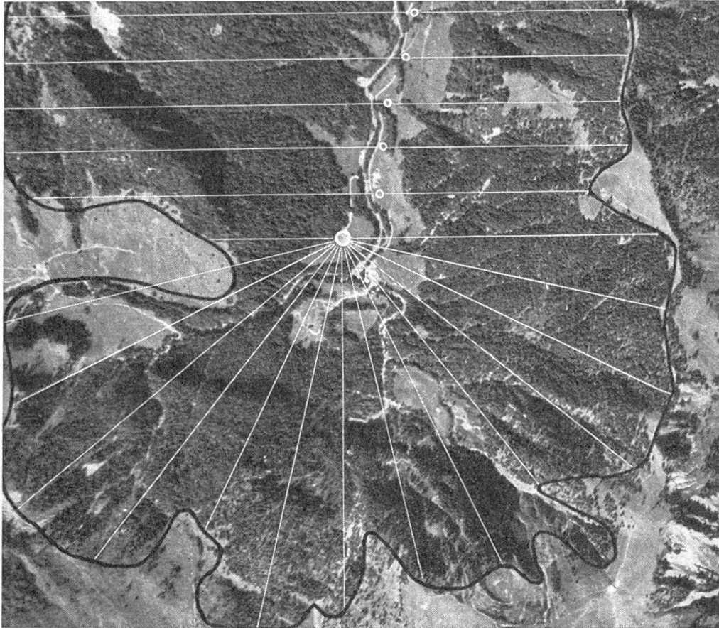
Die Aufzeichnungen auf diesem Bild zeigen schematisch das System der Walderschließung mit dem Seilkran. Die Seillinien können entsprechend den Lagerplätzen an der Straße angelegt werden. Sie brauchen nicht parallel und in gleichmäßigen Abständen zu sein. Normalerweise beträgt die Zuzugsdistanz pro Seite des Seiles 50 bis 75 m Weiße Striche = Seillinien; weiße Ringe = Ablagerungsplätze für das Holz an der Straße; dicke Linie = Waldgrenze

primitiven Methoden das Gegenteil und haben einen viel zu großen Anfall von zurzeit wenig gefragtem Brennholz zur Folge.