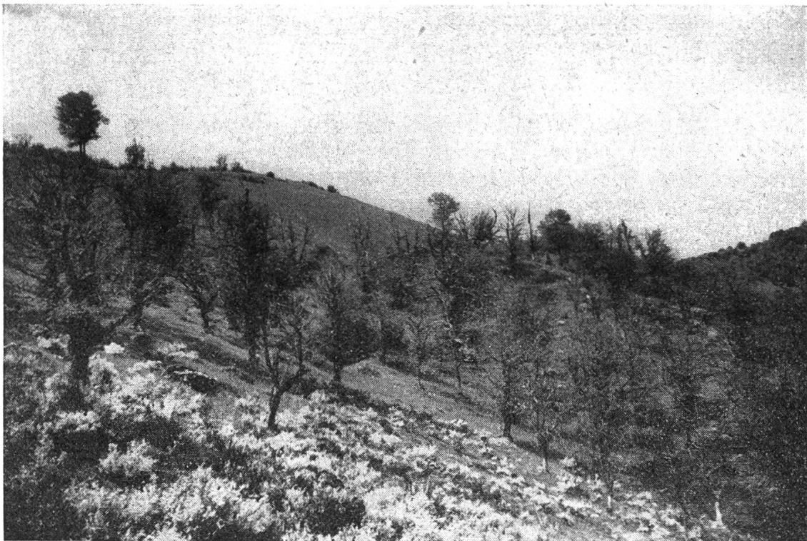
Selve castanili completamente distrutte dal parassita in Valle della Grotta (Cabbio). In primo piano ginestre in fiore.

In conclusione si può affermare, tenendo presente i risultati degli inventari effettuati ed alla luce della presente situazione, che se, prima, della malattia del castagno, il patrimonio castanile poteva numericamente mantenersi ad un livello costante, qualitativamente ha fatto pochi progressi. Ciò è comprensibile se si pensa che, da una parte il prezzo relativamente basso della legna da tannino non poteva facilitare lo svecchiamento delle selve, specialmente di quelle discoste, e d'altra parte il ringiovanimento della selva castanile è stato reso difficile dal vago pascolo caprino; infatti i polloni e le giovani piante dalla corteccia liscia, se mancavano di protezione, finivano presto o tardi di essere malmenate dal morso delle capre; in tanti posti per evitare i danni delle capre si introduceva il cosiddetto taglio a capitozzo. Il processo di rinnovazione veniva poi anche ostacolato, in molti casi, dalle particolari condizioni di proprietà con alberi di privati su proprietà patriziale ( Jus plantandi ).