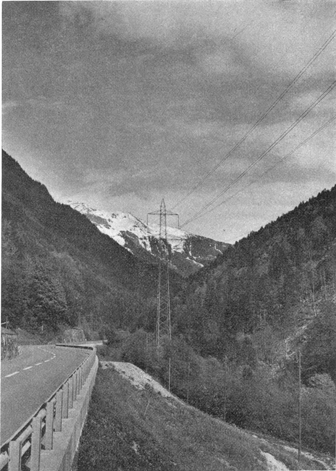
Im engen Sernftal verläuft die 380-kV-Leitung längs des Talflusses. Der Abtransport des Holzes aus den steilen Hangwäldungen mittels Seilkrans ist stark erschwert oder unmöglich.