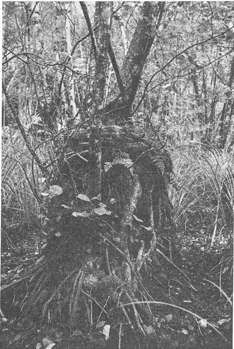
Figure 1. Aulnaie: Aulne sur souche avec Athyrium filix-Femina et Carex elata .

La couche de tourbe varie généralement entre 50 et 150 cm, pouvant dépasser 200 cm au centre. Celle-ci a dû se développer dans des conditions