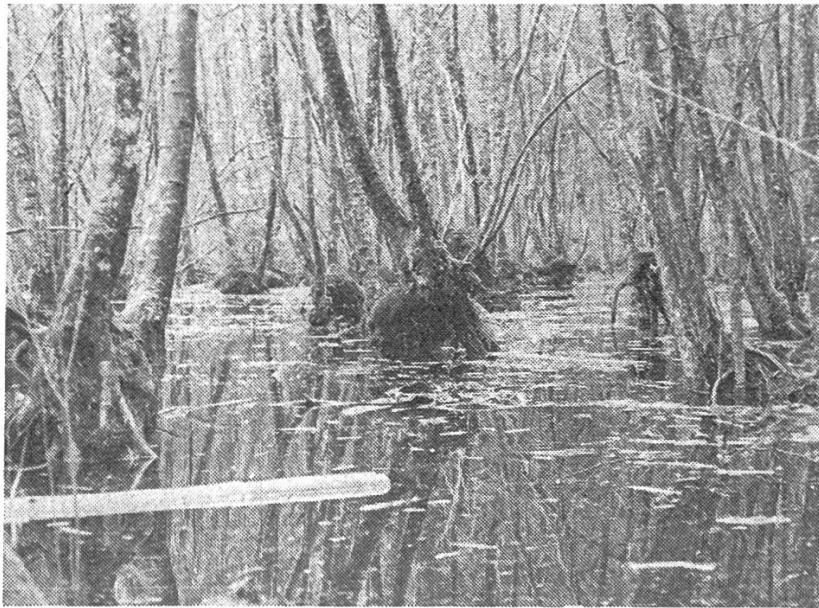
Figure 2. Aulnaie inondé en hiver (20. 1. 1975).

Le développement du «Grand Marais» a pu être le suivant: après une période où le lac était à découvert, un développement rapide d'une aulnaie (sûrement après un stade, très bref, de Carex ; ce développement est peut-être explicable par un abaissement du niveau du ruisseau sortant du lac).