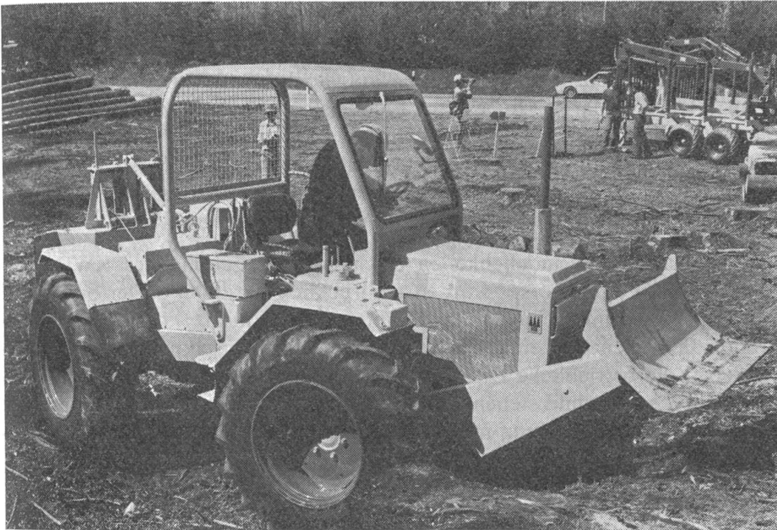
Mit geringeren Dimensionen als die üblichen Knickschlepper wird der HSM-Forstspeziialschlepper WS 70 eine Lücke ausfüllen.