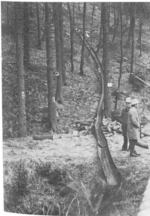
Beim Aufbau der Trasse kann zum Bergauf-Transport der Halbrohrschalen der «Leykam-Log-Line» eine kleine Seilwinde verwendet werden.