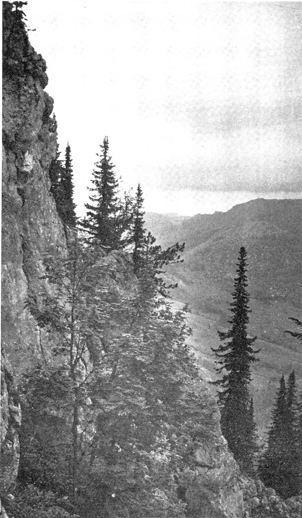
Picea omorika Paničić. Zrezda-Canyon de Drina, 1200 m ü. M. (Serbien).