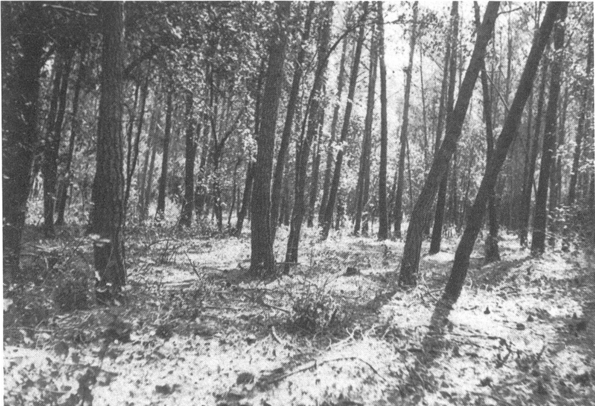
Figure 1. Les incendies en forêt méditerranéenne diminuent lorsque le sous-bois est enlevé.