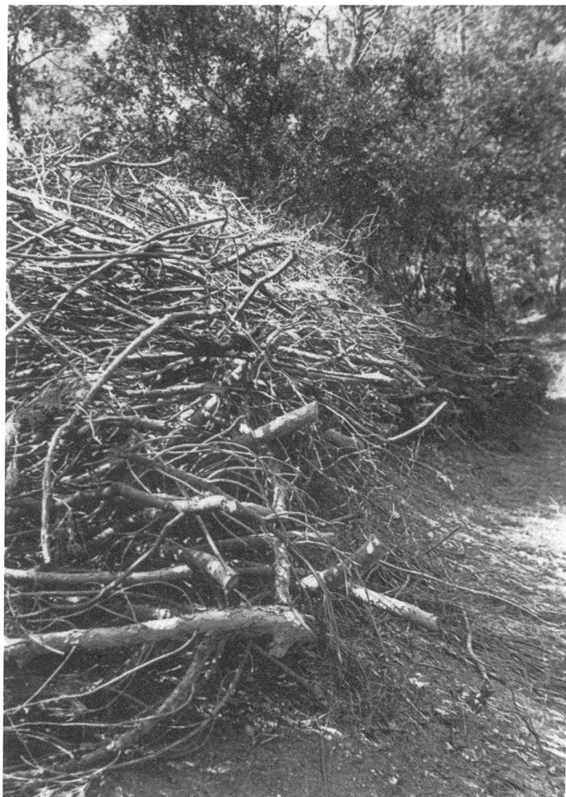
Figure 2. Le stockage des produits de nettoyage et des soins culturaux.