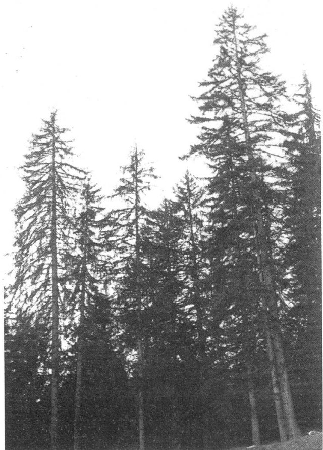
Abbildung 3. Stark immissionsgeschädigter Fichtenwald in subalpiner Lage. Bannwald Maladers.