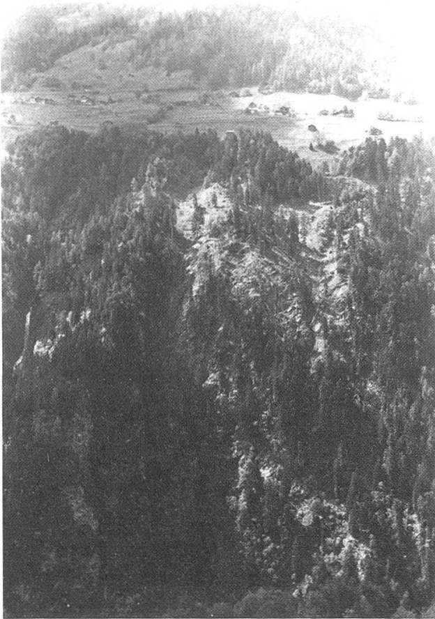
Abbildung 2. Rutschung mit Borkenkäferbefall und Windwurf. Verlust des Waldes führt zu tiefen Erosionsrinnen und gefährdet die darüber liegenden Siedlungen. Gemeindegüter Ausser Praden.