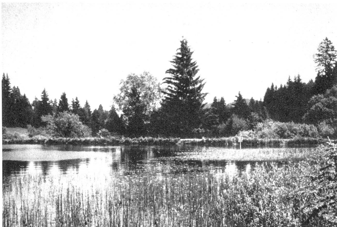
Figure 2. Les étangs de Bonfol.