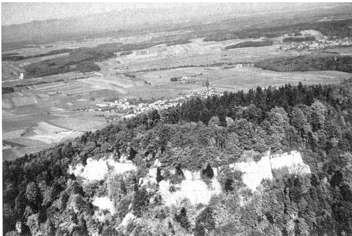
Figure 1. Champs et forêts d'Ajoie vus par-dessus le Mont-Terrible.