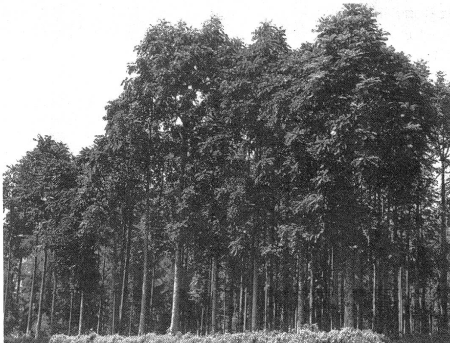
Figure 5. Peuplement semencier de l'espèce locale Entandrophragma excelsum ; parcelle de l'arboretum de Ruhande, Butare (Rwanda).

supérieurs aux pieds mères. Un tel réseau donne d'autre part une garantie d'approvisionnement, indépendamment des aléas du commerce des graines forestières.