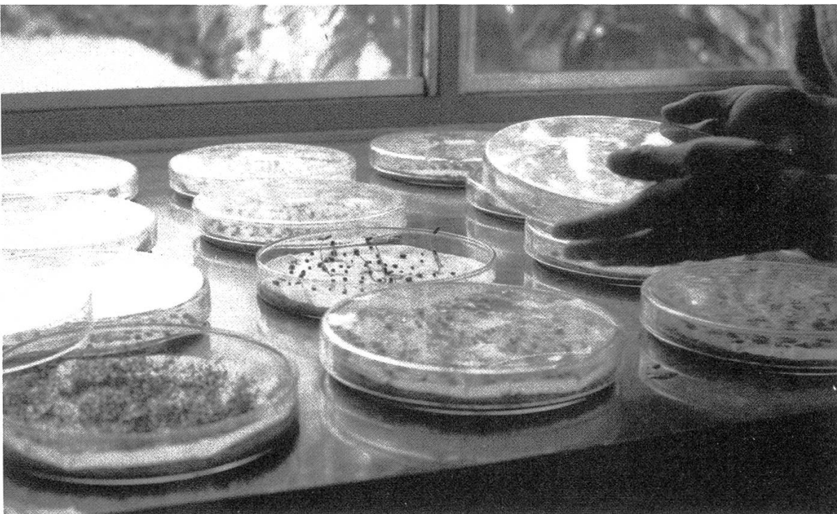
Figure 3. Test germinatif en laboratoire.