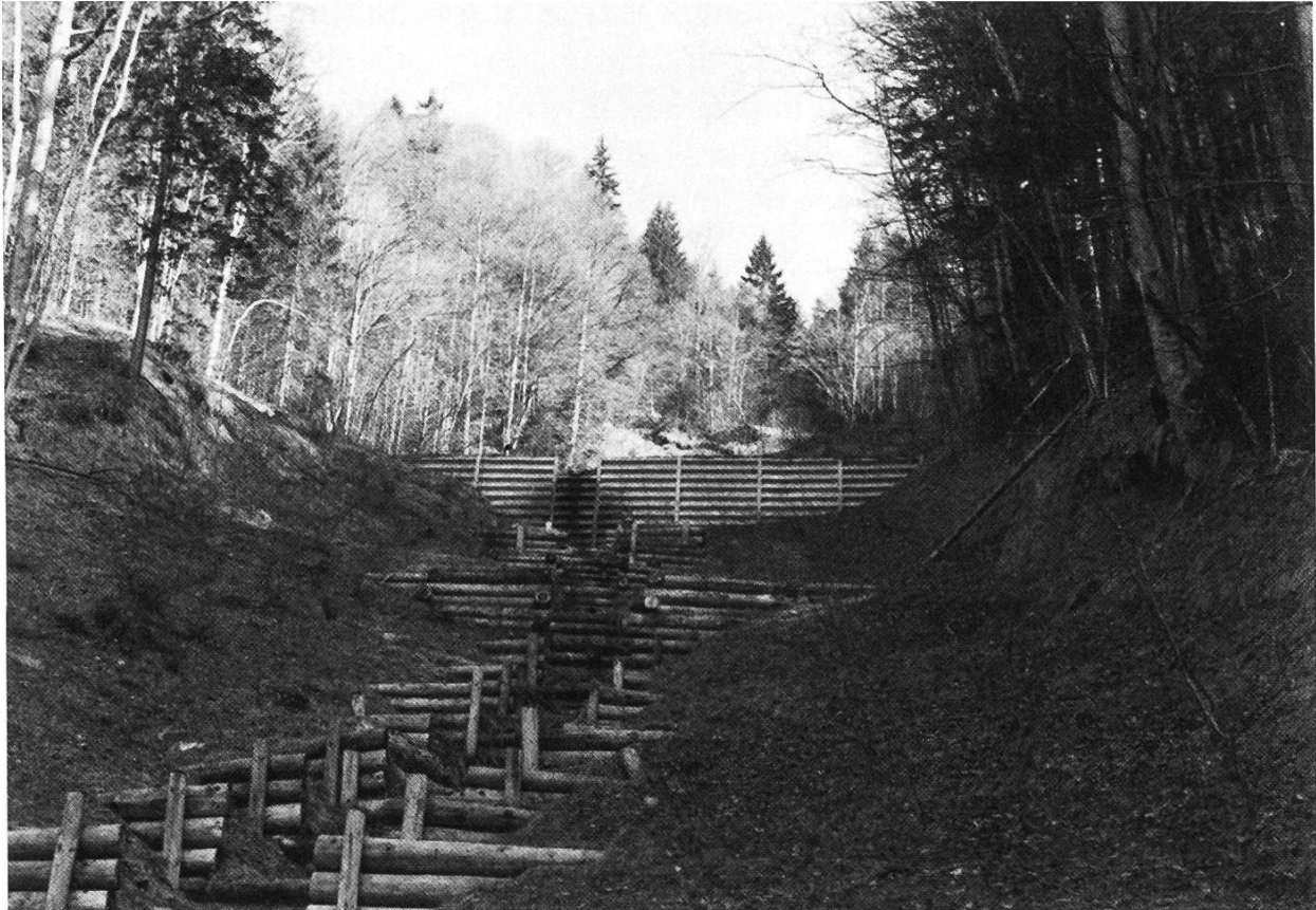
Abbildung 4. Transportzone mit einfachen Holzsperrern, Holzkastensperrern und Kassetten-Stützwand.