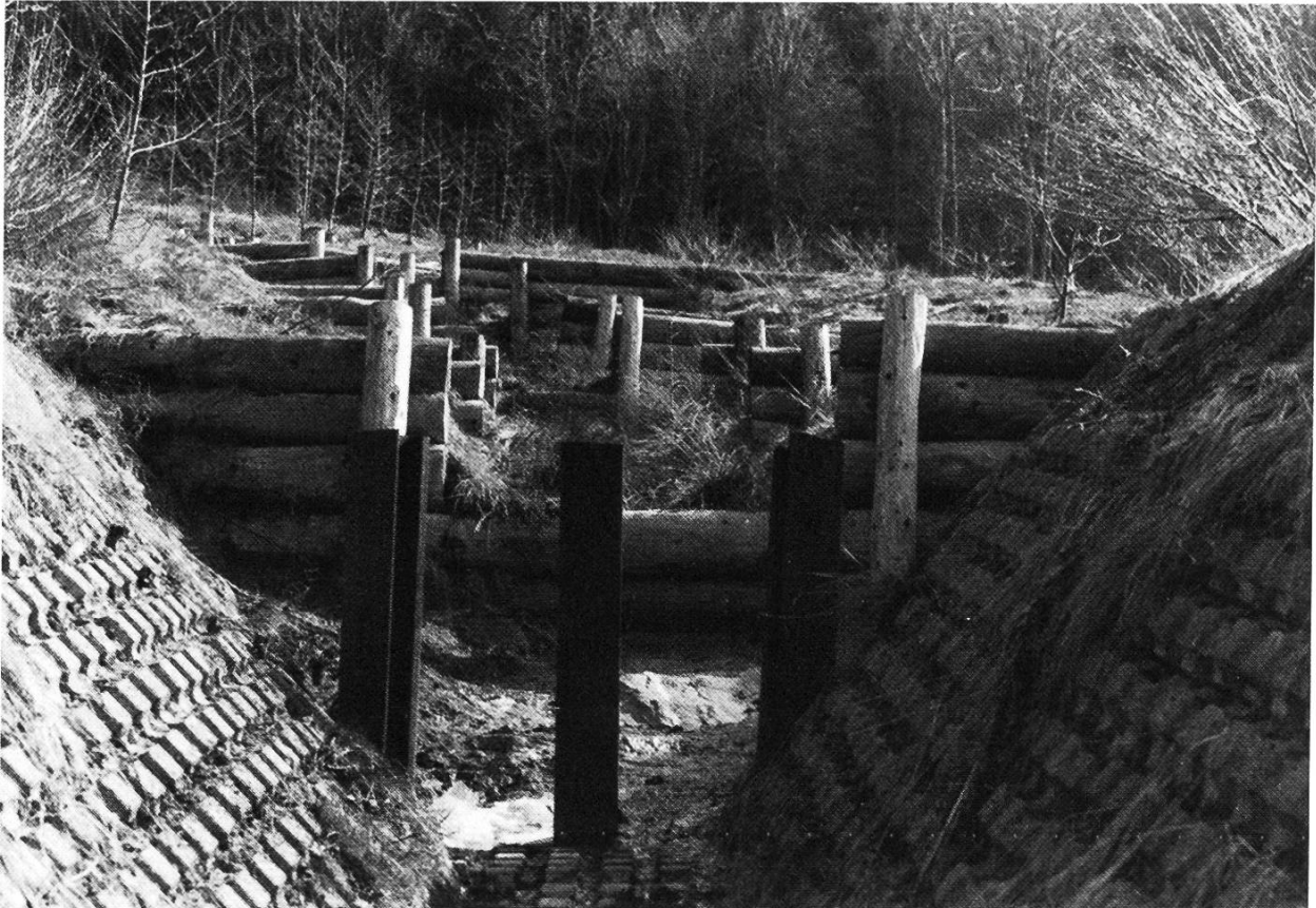
Abbildung 3. Übergang von den einfachen Holzsperrern zum offenen Graben mit UK-Steinen.

zinkten Blechelementen zusammengesetzt, die durch Schrauben miteinander verbunden sind. Ordnungsgemäss mit Erdmaterial verfüllt und gut entwässert übernehmen sie die Funktion einer Schwergewichtsmauer. Die Gesamtlänge der Kassetten-Stützwand beträgt 22,88 m, die Höhe schwankt zwischen 3,25 bis 5,29 m. Die Wand steht durchgehend auf festem, unverwittertem Mergelfels.