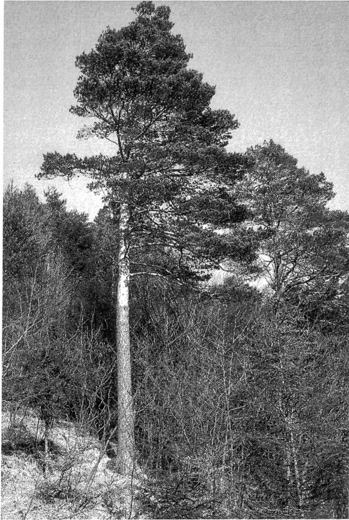
Abbildung 3. Föhrenstandort im Gebiet des Rheintals (Marbach).

Im Hügellgebiet der Gemeinden Oberriet und Wartau und an den Prallhängen entlang der Thur und des Necker im Toggenburg sind noch Reliktstandorte der Föhre zu finden ( Abbildung 3 ).