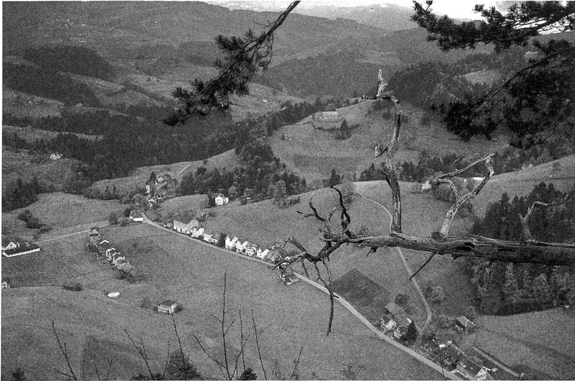
Abbildung 1. Typische voralpine Hügellandschaft im unteren Toggenburg.

Der Nordosten des Kantons wird von der Mittelländischen Molasse gebildet. Richtung Süden geht diese dann in die stärker gefaltete und teils sogar überschobene Subalpine Molasse über. Die steil abfallende Nordwand des Speers gibt einen Eindruck von der Menge des Schuttes, den der Urrhein, damals noch in der Gegend von Weesen ins Flachmeer des nördlichen Mittellandes mündend, zusammen mit den andern Alpenflüssen abgelagert hat.