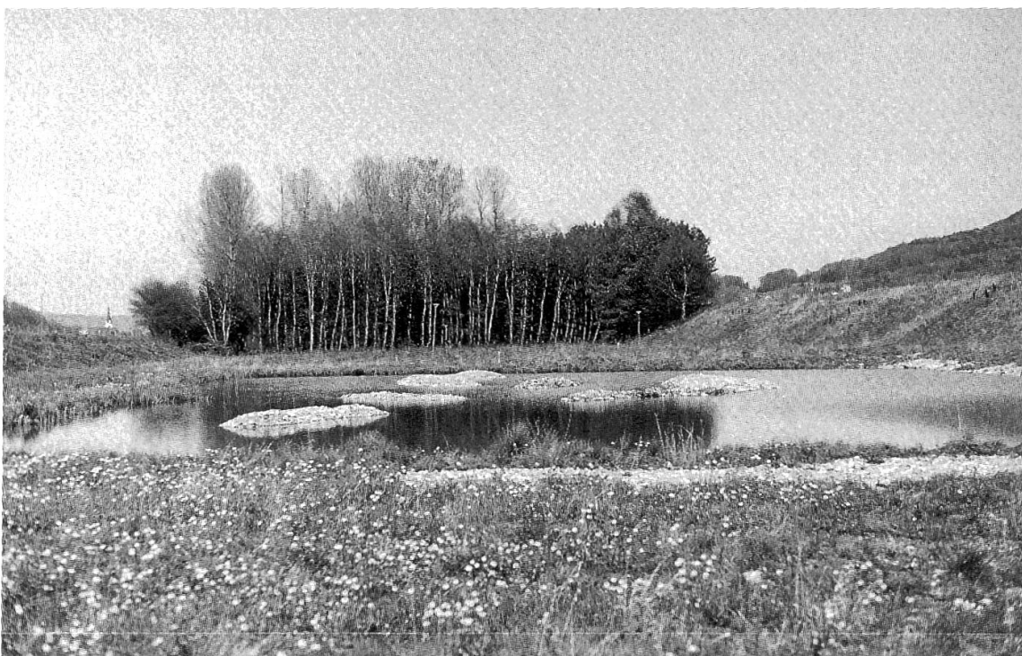
Abbildung 5. Künstlich angelegte ökologische Ausgleichsfläche im Rheintal bei Oberriet. Die Geländegestaltung ist ein Gemeinschaftswerk des Nationalstrassenbaus, des Rheinunternehmens und des Forstdienstes.

Weniger erfreulich sind die zunehmenden Aufgaben im Bereiche der Rechtssprechung. Die Richtung Wald wachsenden Bauzonen, die steigende Bevölkerungszahl und der enorme Freizeitdruck auf den Wald bilden die Hauptursachen für die stark zunehmenden Rechtsfälle. Komplizierte Koordinationsverfahren mit andern Amtsstellen und Organisationen lassen bereits kleine Vorhaben zu grossen Unternehmungen anschwellen.