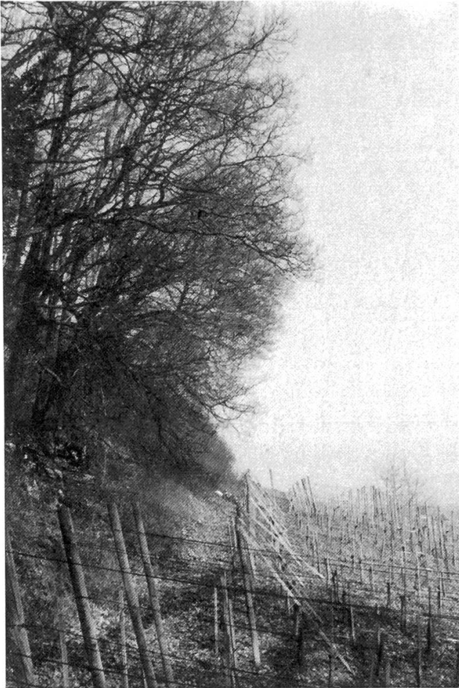
Figure 3. L'abri de la forêt se fait menaçant.