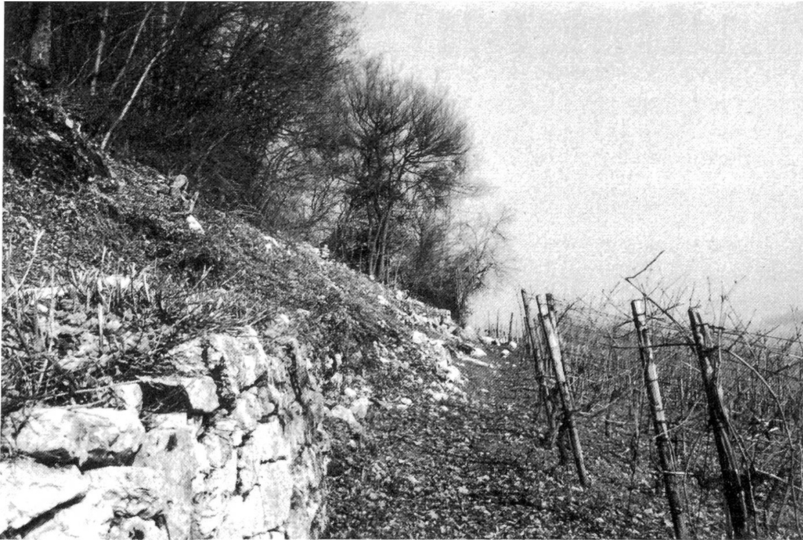
Figure 2. La lisière rabattue – biotope des reptiles.

alors la toute violette orchidée saprophyte Limodore ( Limodorum abortivum ). Les sorciers et sorcières qui célébraient jadis leurs messes noires dans la combe, sous la chute du Pilouvi, connaissaient sûrement leur utilisation dans la pharmacopée.