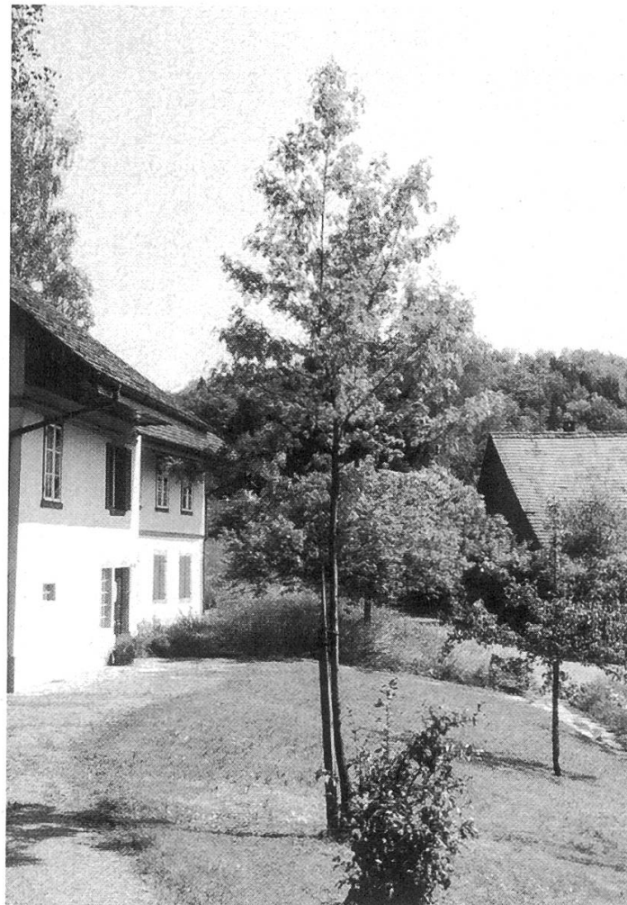
Abbildung 1. Speierling vor dem Dorfmuseum Birmensdorf.

Selten weiss man von einem Baum, woher sein Same stammt, wer seine Eltern sind, wo – wenn der Same von Menschenhand gesammelt worden war – er gepflegt und gehegt wurde. Dass