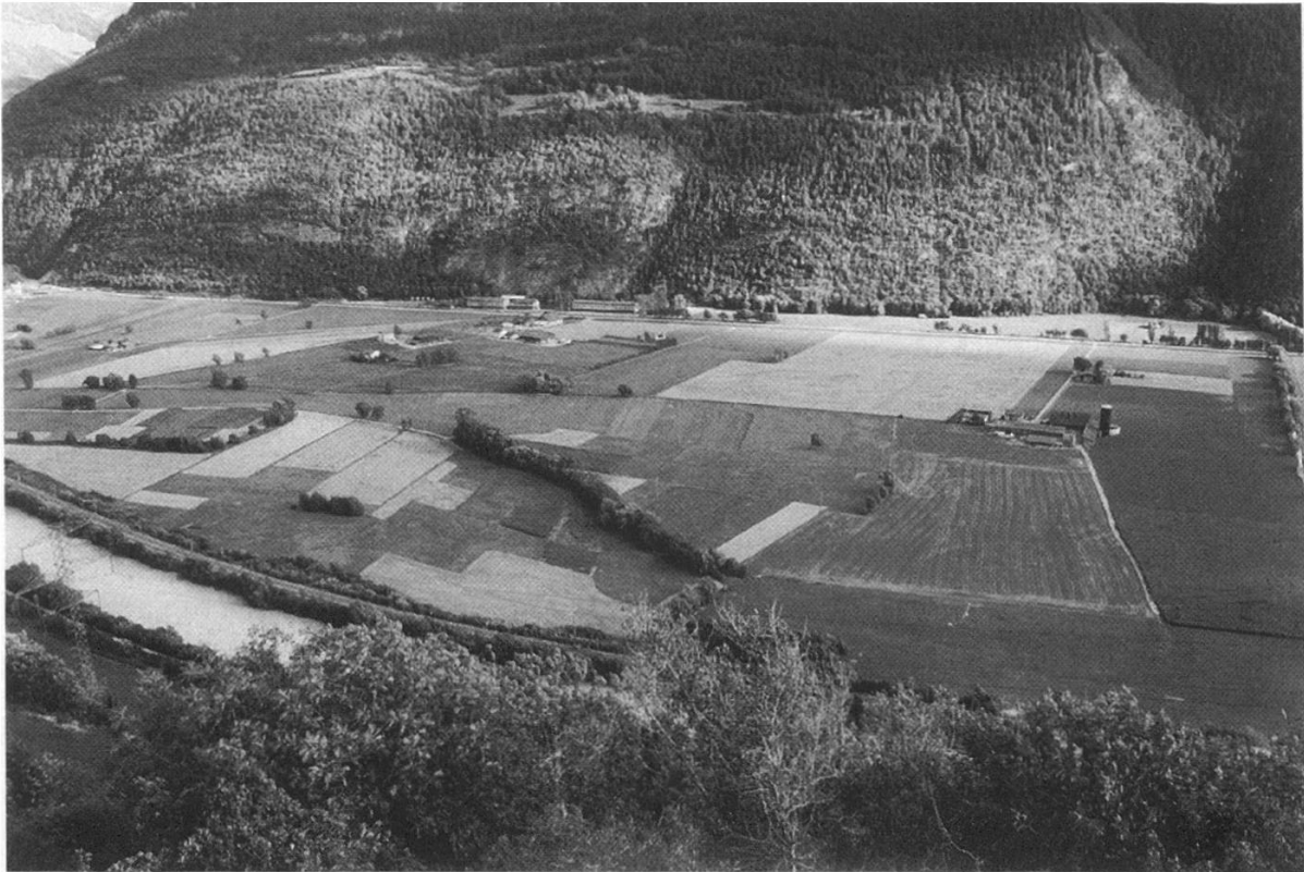
Abbildung 2. Die Grosseia westlich von Visp. Die Landschaft ist auf der Seite der Gemeinde Visp (obere Hälfte der Talebene) grösstenteils gehölzfrei und macht einen ausgeräumten Eindruck.