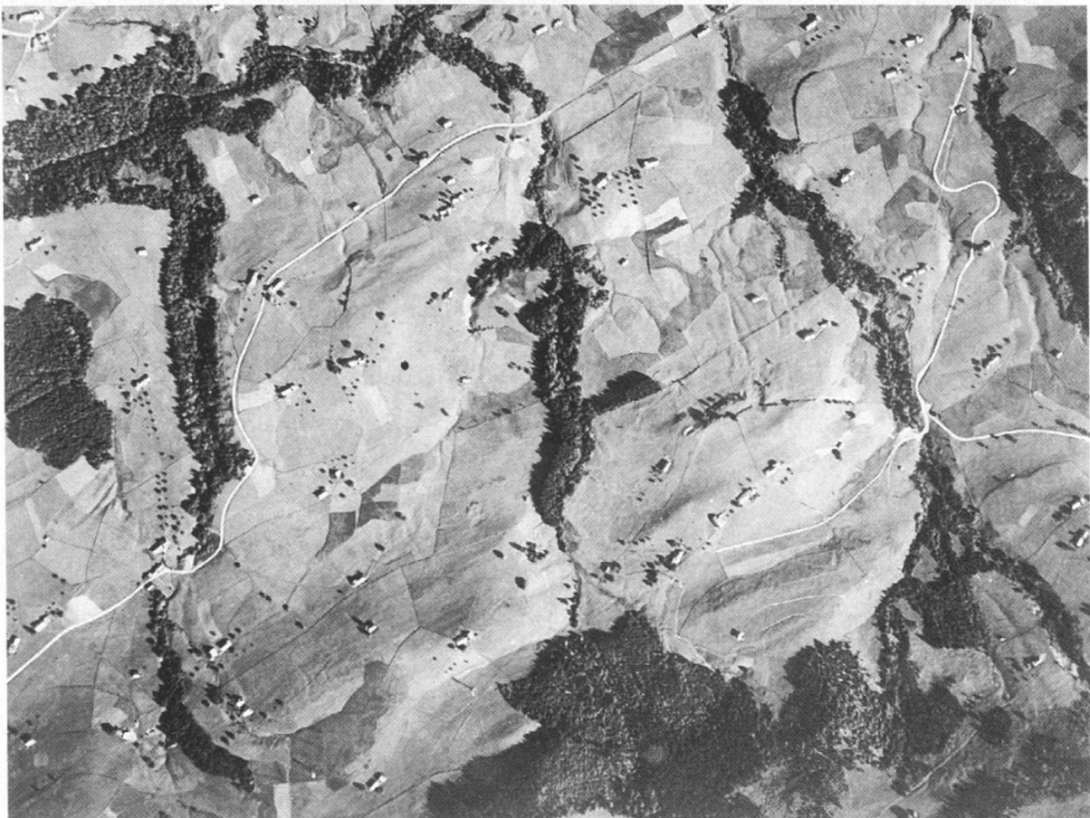
Abbildungen 1 und 2. Zwei Gesichter der ausserrhodischen Kulturlandschaft. oben: Das Vorderländer Dorf Reute, eine durch Rodung entstandene Siedlungsinsel im Waldland. unten: Hinterländer Einzelhofgebiet bei Schönengrund mit geringen, auf Bachläufe und Steilhänge reduzierten Waldflächen.