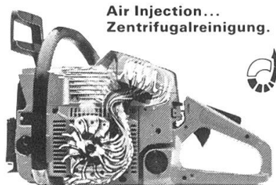
Air Injection... Zentrifugalreinigung.