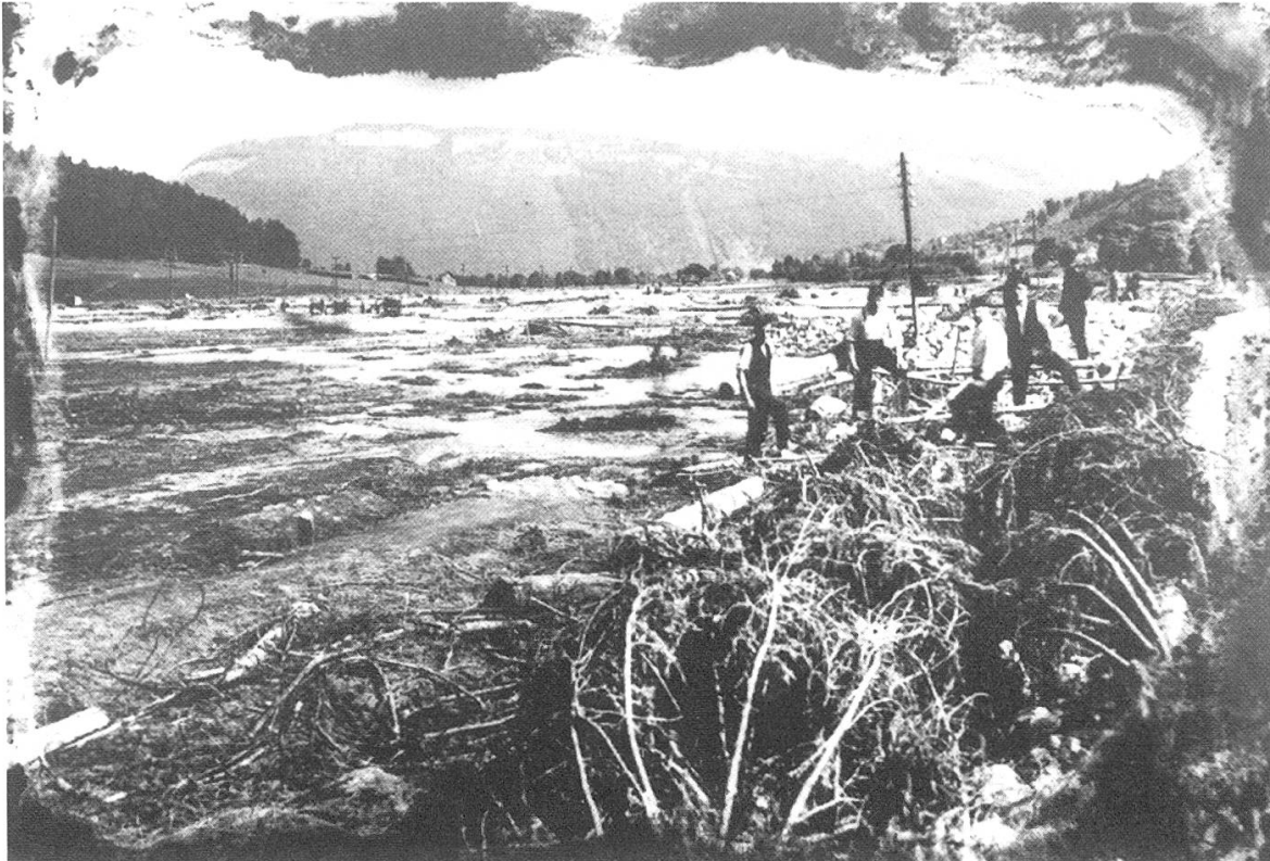
Abbildung 1. Hochwasser vom Juni 1910. Blick von Büren in Richtung Stans.

Die Schutzdämme und Wuhren, die in den folgenden Jahrhunderten von der hochgehenden Engelberger Aa immer wieder beschädigt und zerstört worden sind, wurden erst ab 1911 massiv gebaut und verstärkt. Anlass dazu war wieder ein Katastrophenhochwasser. Im Juni 1910 durchbrach die Engelberger Aa die Dämme oberhalb Büren und setzte die Stanserebene in diesem Jahrhundert letztmals unter Wasser ( Abbildung 1 ).