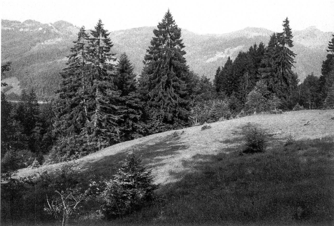
Abbildung 4. Flachmoor von möglicherweise nationaler Bedeutung im Gwürzwald.

Die recht grossflächigen Flachmoore von teils nationaler, teils regionaler Bedeutung können mit bautechnisch annehmbaren Linienführungen nicht