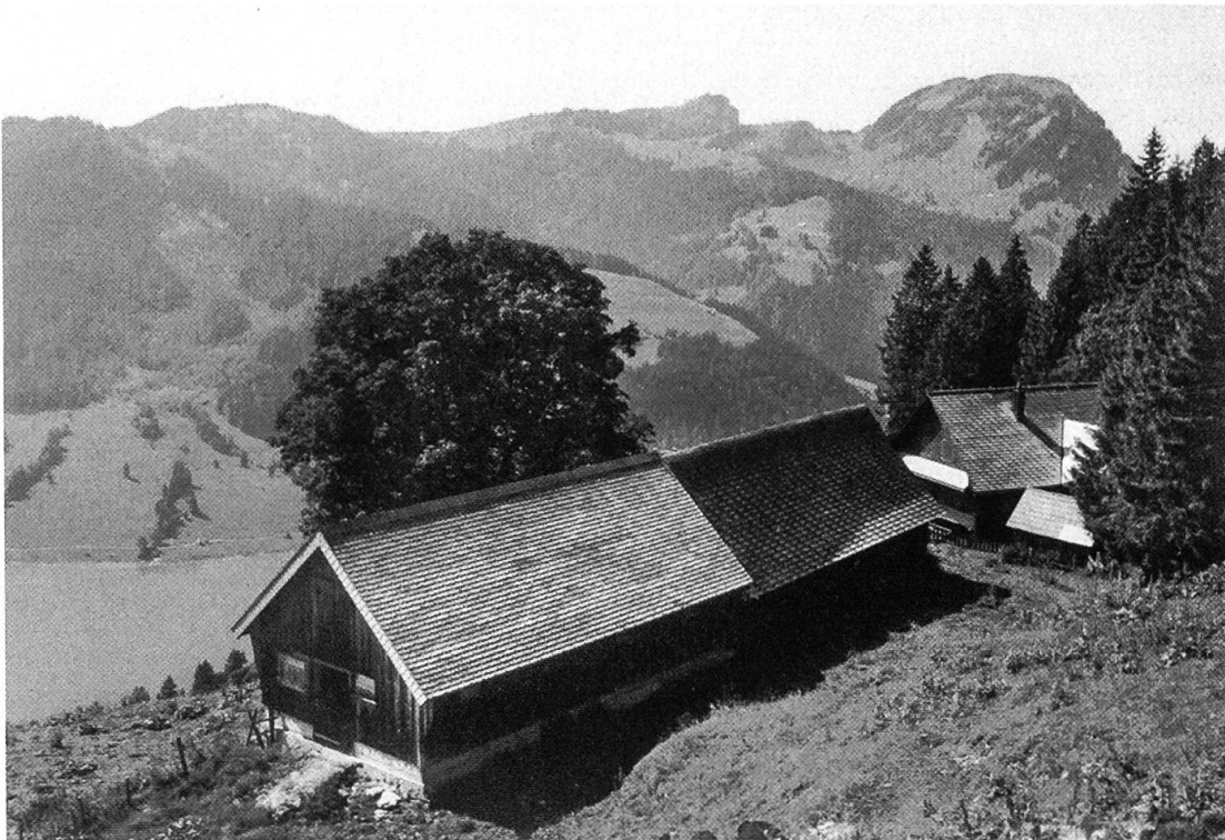
Abbildung 5. Alp Hohfläsch, unterster Stafel mit Rinderstall und touristisch genutzter Hütte.

Die Vorkommen von Rauhfusshühnern lassen sich nicht mit der für die Erschliessungsplanung gewünschten Genauigkeit abgrenzen. Grundsätzlich wäre wünschbar, Gebiete mit aufgelösten Bestockungen grossräumig ungestört zu lassen.