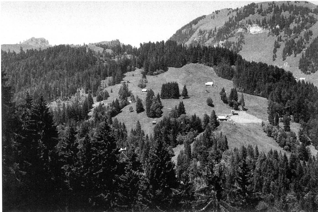
Abbildung 3. Gebiet Eggstofel-Rohr-Bärlai; in Bildmitte Flächen mit Heu- und Streunutzung.

Der Tourismus spielt bezüglich Erschliessung eine geringe Rolle. Es sind einige touristisch genutzte Hütten vorhanden ( Abbildung 5 ). Bestehende und projektierte Wege und Strassen sind für die Benützung durch Fussgänger und Radfahrer vorgesehen. Die Wertschätzung verschiedener Baustandards und