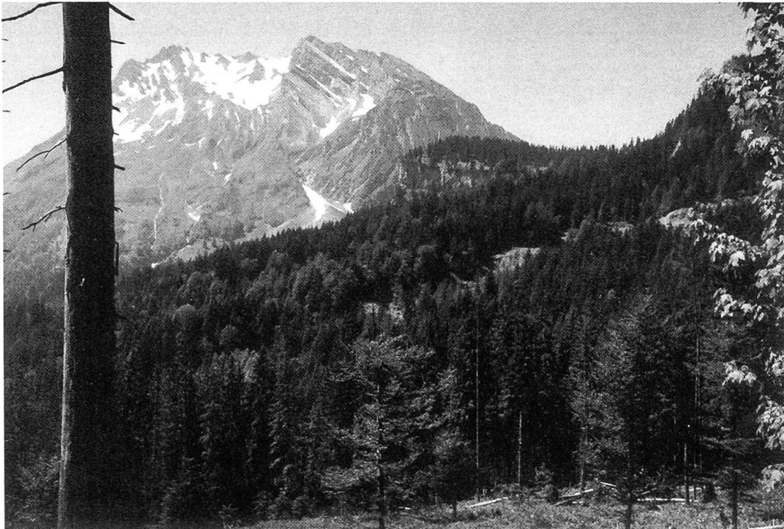
Abbildung 2. Allmeindwald; in Bildmitte der südliche Rand der Grossrutschung.

Nutzungsanteilen, teils natürlichen Personen. Die Wälder gehören teils den Korporationen der Märchler Gemeinden, und zwar in relativ kleinen, unzusammenhängenden Parzellen, teils Genossamen und Alpengenossenschaften und teils natürlichen Personen. Nur ein kleiner Teil des Bodens gehört Innerthalern; der weitaus grössere Teil gehört Kollektiven oder Einzelpersonen aus der March und wird auch von diesen bewirtschaftet. Zwecks Realisierung und Unterhalt der Infrastruktur sind die Grundeigentümer in Flurgenossenschaften zusammengeschlossen.