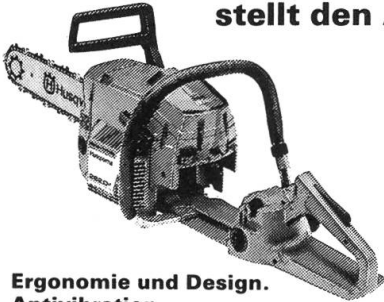
Ergonomie und Design. Antivibration.

Das Husqvarna-Konstruktionskonzept stellt den Anwender in den Mittelpunkt.