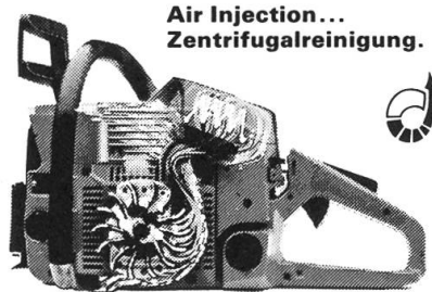
Air Injection... Zentrifugalreinigung.