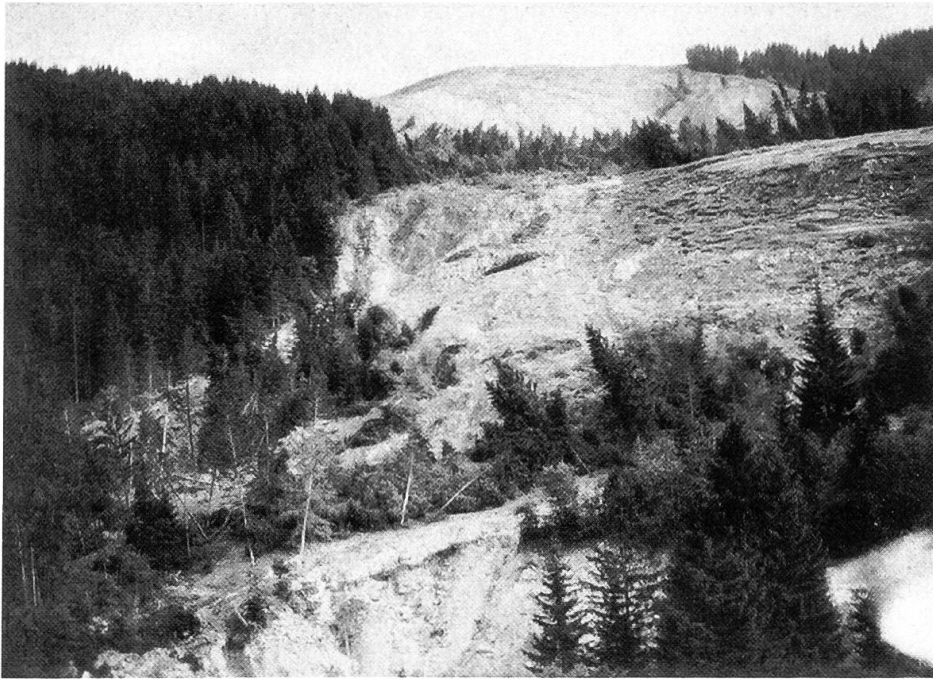
Abbildung 1. Rutschung Räschera 1933.