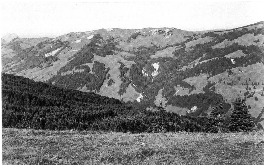
Abbildung 4. Landschaft am Schyberg Osthang, im Vordergrund die Aufforstung Glungmoos.

bleme besser meistern zu können. Die gebietsumfassende Zusammenarbeit ermöglicht Werke, die im Alleingang nicht ausführbar wären. Das Oberland steht erneut vor einer grossen Herausforderung, ist aber nun in der Lage, sein Geschick in die eigenen Hände zu nehmen und einer guten Zukunft entgegenzuführen.