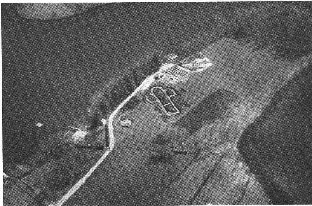
Fig. 2. Landzunge mit Ausgrabung von 1941.