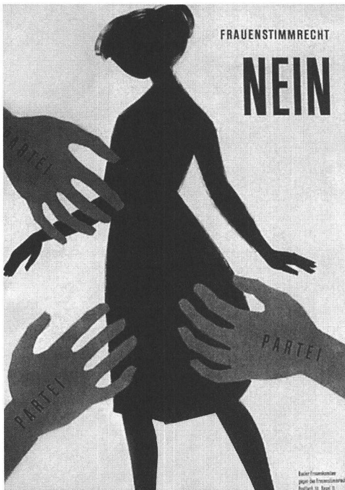
Affiche de votation 1959

Pourquoi, doit-on se demander, politique et féminité sont-elles incompatibles? On comprendra mieux les notions dualistes en jeu, si l'on s'arrête un instant sur les prises de parole des représentants populaires venant d'un canton ayant conservé la tradition de la Landsgemeinde . Lors du débat de 1958, tous les orateurs de ces cantons sont violemment opposés à l'introduction du suffrage féminin. L'on sait aussi que la résistance y fut la plus longue et la plus tenace. Le principe de la Landsgemeinde est que tous les citoyens y participent. Or cela n'est pas possible avec le suffrage féminin, car il faut bien que quelqu'un garde la maison, le foyer, dit le catholique-conservateur nidwaldien Joseph Odermatt en 1958 51 . Pour fonctionner, la Landsgemeinde doit donc rester un lieu d'hommes.