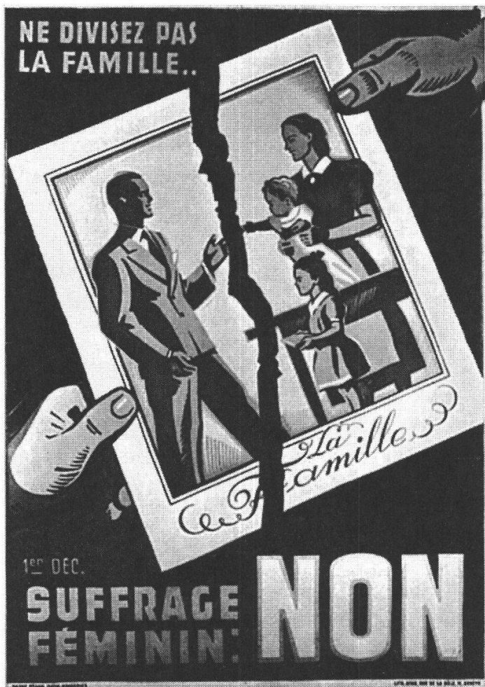
Affiche de votation 1940

L'espace familial doit être préservé de la politique. Si celle-ci y pénétrait, elle n'y fomenterait que des conflits, estime par exemple le conseiller aux Etats Werner Christen en 1958 42 . Avec d'autres mots, le porte-parole de la minorité de la commission du Conseil national opposée au suffrage féminin dit en substance la même chose: le fait que les femmes ne votent pas est une correction bienvenue à la trop grande politisation de la vie moderne 43 .