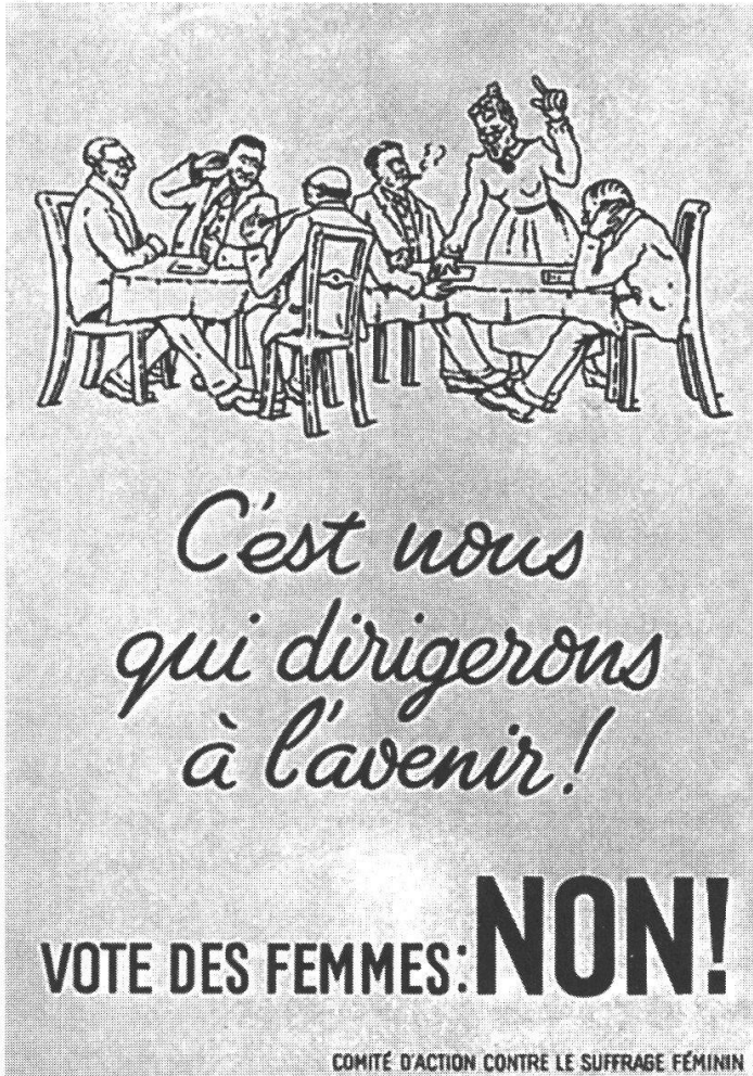
Affiche de votation, s. d.

comprennent non seulement le droit d'élire et d'être élu, ainsi que le droit de vote, mais aussi, dès 1874, respectivement 1891, le droit de référendum et d'initiative. Outre élire ses représentants, le citoyen actif suisse décide aussi d'une vaste palette de questions politiques, sociales, économiques et culturelles de la commune, du canton et de la Confédération. Au niveau de la commune notamment, ce droit de décision ne se limite souvent pas à une voix déposée dans l'urne. Dans de nombreuses assemblées communales, la participation est ouverte à tout citoyen actif. Le droit que briguaient les femmes peut être taxé dans la démocratie semi-directe et directe, comparativement aux démocraties représentatives, de droit politique «à valeur ajoutée». Cette distinction conserva aux droits politiques suisses une aura de droits substantiels et de grande portée 13 , alors même