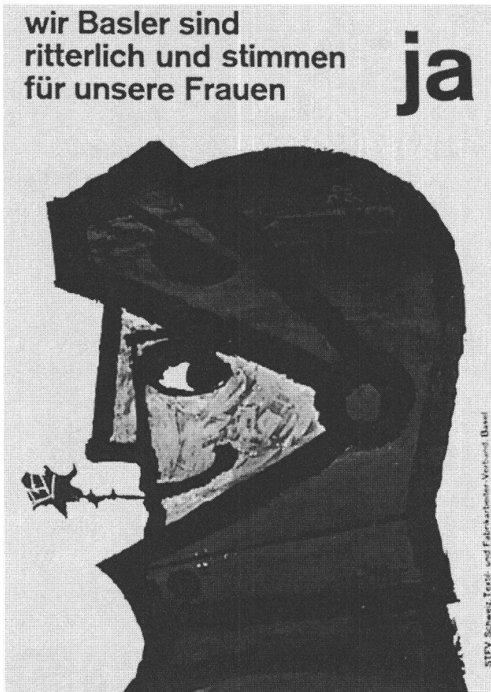
Affiche de votation 1959

«l’octroi de droits politiques aux femmes» risque de «mettre en question [...] non seulement l’unité familiale mais aussi le juste rapport entre homme et femme» 72 .