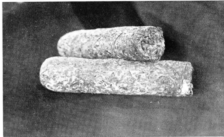
Abb. 2. – Reinkulturbrut (Kartuschenbrut). Verkleinert.

Champignonkultur nach modernen Grundsätzen.