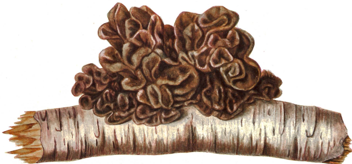
Tremella foliacea Fr. (ex Pers.) (Fleischbrauner Zitterpilz)